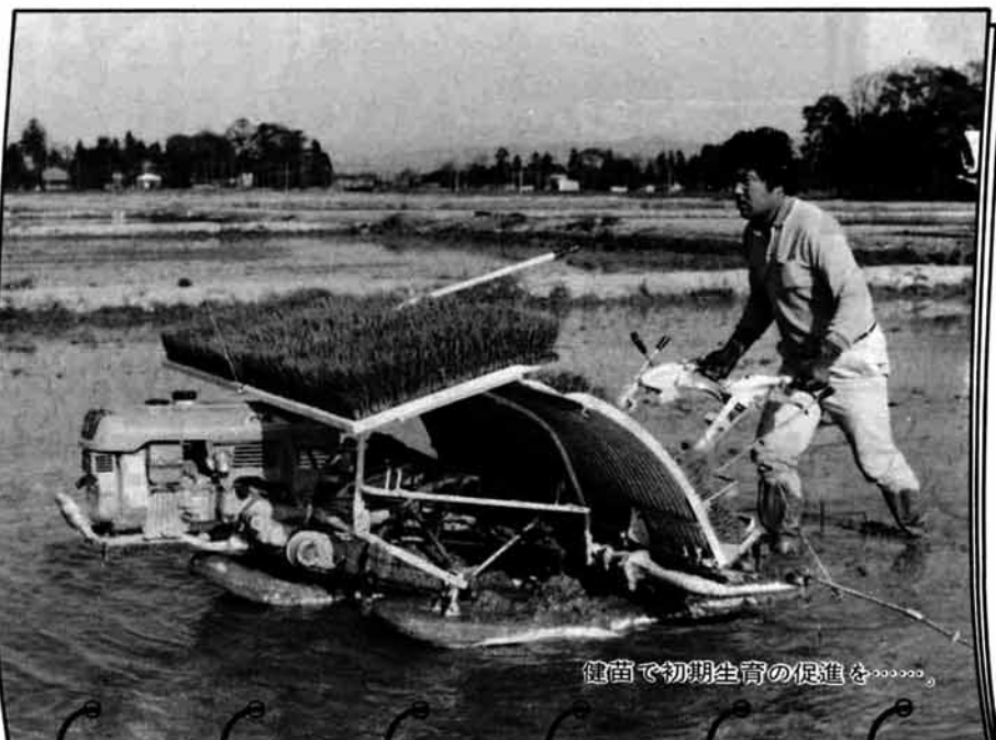
健康で初期生育の促進を

昭和58年5月15日 発行 新潟県三島郡三島町役場 (025842)代 2 2 2 1 印刷 長岡市 中越タイア社