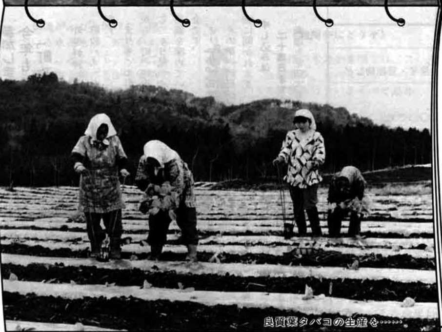
良質葉タバコの生産を