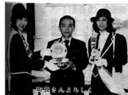
町長さんよろしく

七月一日から始まる新潟博覧会のPRと前売券販売のお願いのため、去る四月十二日ミス新潟博が役場へ訪れました。