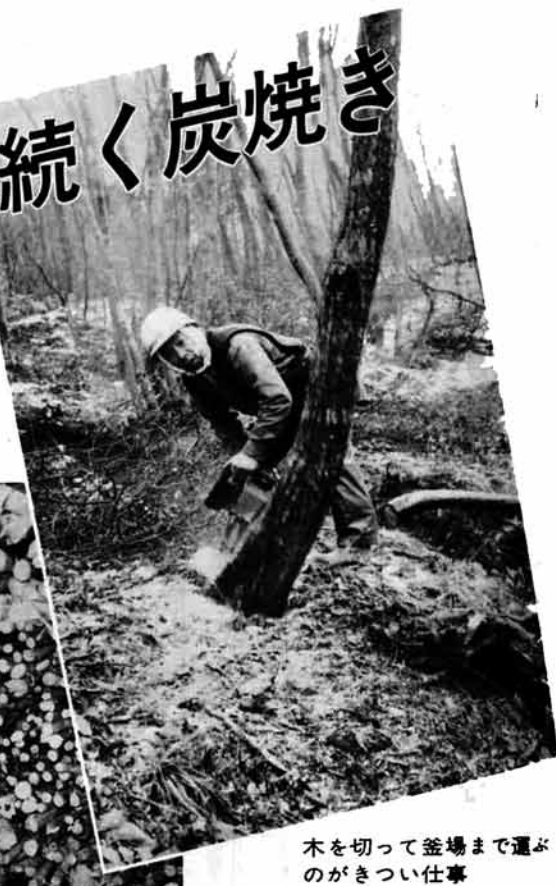
木を切って釜場まで運ぶのがきつい仕事