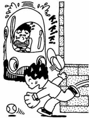
常に子供の特性を知って安全運転を。