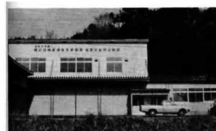
拠点センター(左)と事務所(右)

が、町内の県道、町道を合わせて実に、七百四十万円(五十五年)もかかっています。 便利な消雪パイプも、ばく大な経費がかかっていることを忘れてはなりません。少し雪をつけてはなすようにすれば、運転時間を減らすようにすれば、電気料が節約できるばかりでなく、道路に人為的に出した雪を消すためや、雪が降りやんでも運転し続けるなどということのないようお気をつけください。 個人用の消雪用パイプについても、同じように気を配り、地下水の節