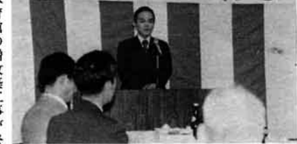
新しくできた3階で行われた完工式