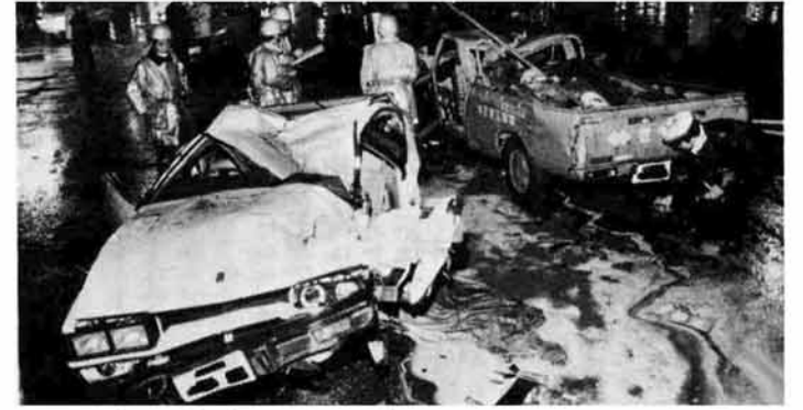
道路交通法第65条第1項「何人も、酒気を帯びて車両等を運転してはならない」

十二月十一日から一か月間「冬の交通事故防止運動」が、気をつけよう、スピード、ブレーキ冬の道」をスローガンに実施されています。