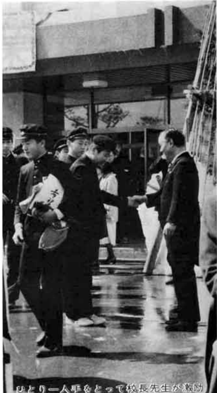
ひとり一人手をとって校長先生が激励

「諸君を迎える社会には俗悪や誘惑がはびこり、困難と苦悶が待ち構えている。これにおびえたり、逃避することなく試練として受け止め、勇気と自信をもって立ち向かえ。そして信頼され、尊敬される世界のよき友、優れた世界のリーダーを目指せ」校長先生の贈る言葉。胸に秘めて八十三人の三島健児は巣立った。 その日、三月十三日。まぶしいばかりの春の日に、白い雪の雫も水しずくで光り輝いていた。