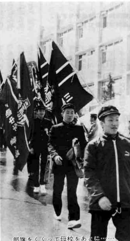
部旗をくくって母校をあなご