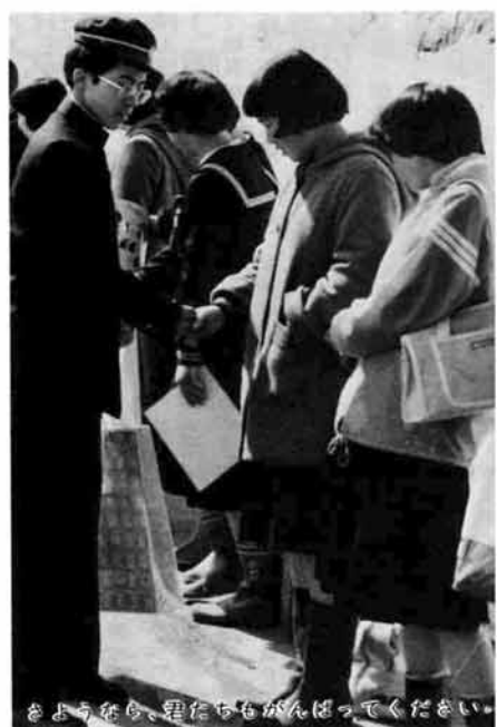
さようなら、君たちもがんばってください

「諸君を迎える社会には俗悪や誘惑がはびこり、困難と苦悶が待ち構えている。これにおびえたり、逃避することなく試練として受け止め、勇気と自信をもって立ち向かえ。そして信頼され、尊敬される世界のよき友、優れた世界のリーダーを目指せ」校長先生の贈る言葉。胸に秘めて八十三人の三島健児は巣立った。 その日、三月十三日。まぶしいばかりの春の日に、白い雪の雫も水しずくで光り輝いていた。