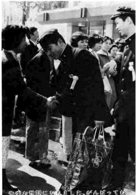
先生を世話に頼りました。がんばってね