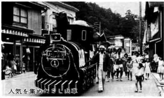
人気を集めたSL山車

この記事は与板領内の二か村についてであるが、これだけの被害が生じたという事は、この近郊にかなりの被害をもたらしたと考えられる。町史編纂の過程で天明期の飢饉の発生状況や被害、その救済対策などを具体的に解明されることを期待したい。