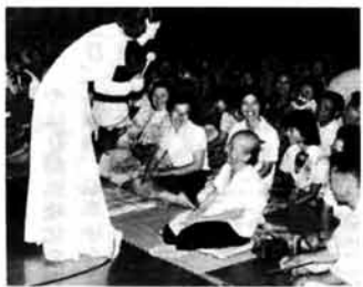
歌手の村上幸子さんはステージを降りて大サービス