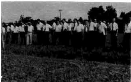
転作水田のあぜ道で説明を聞く視察団

いずれにせよ、我らの祖先の力の偉大さを示すものであり、県下はおろか全国に向けて高々と誇り得るものである。 この歴史的文化遺産は静かに眠っているが、この顕現は子孫に託されている。他人事のようにいつ覚めるともなく眠っている訳にはいかないであろう。 まず町民が自覚し協力し、運動を始めなければこれらの貴重な文化遺産は世に問われることなく、再び眠りから覚める機会を逸して終るのではなからうか。 祖先の霊は現世に顕彰されることを喜ぶ。これが先祖供養の本質であり、家族や社会の発展につながるということである。