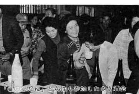
「COCOLALA」と女性も参加した会合