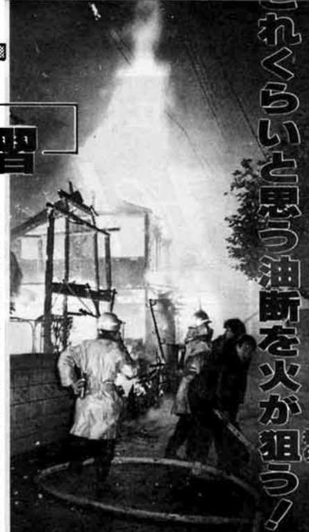
「吉崎が火事」本番さながらの演習