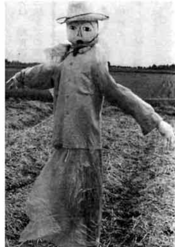
「かかし」も時代の推移ととも出れが、大きな変化の時を映し、それが農林業センサスのねらいです。

農業や林業の基本構造の現状と動向を明らかにし、農林行政諸施策推進の重要な基礎資料とする「一九八〇年世界農林業センサス」が実施されます。調査対象となるのは、町内で一定規模以上の農家と林業を営む世帯です。この調査にあたる三十七名の調査員もさきほど決まり、二月一日の調査日にむかって本格的な準備作業が始まりました。