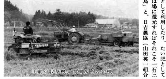
手前が収草機、向側がさん包機

「稲刈後のワラ焼きは、百害あつて一利なし、それより粗飼料として利用したり、たい肥としてほ場に還元すればそれこそ一石三鳥」と、日吉農協(山田英一組合