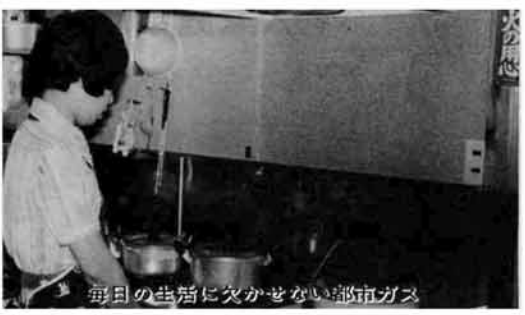
毎日の生活に欠かせない都市ガス

ガス企業団で購入している原ガスが、三十一日あまり値上げされることが明らかになりました。このため、原ガスの値上げが大きいガス事業では、料金改定を迫られるのは必死の情勢です。 原ガス価格は現在、一立方メートル三十二円ですが、十月一日から四十二円になります。 ガス事業は、生活に直接影響を及ぼし、文化的な生活に欠かすことのできない、いわば現代の「生活必需品」だけに、原ガス価格、供給料金ともに、通産省(局)の厳しい監督下にあり、常に需要者の負担、事業の経営内容などがチェックされています。 さらに、増え続ける需要にこたえるために次々と行われる新ガスの開発には巨額の経費を必要と