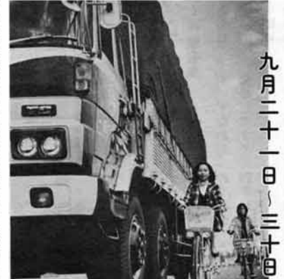
九月二十一日～三十日

今年も九月二十一日から三十日までの十日間、秋の全国交通安全運動が繰り広げられます。今年に入って交通事故による死者数は減っていますが、発生件数、負傷者数は依然として減少していません。 このような背景から、今年、①子供と老人の交通事故防止②自転車の安全利用の促進③安全運転の確保とシートベルト着用の推進。の三項目を重点に国民総ぐるみで秋の交通安全運動が行われます。 一方、新潟県でも、越後路は、ゆたかき、ゆとり、ゆずりあい。をスローガンに、事故防止の徹底を図ることにしています。 たとえば、子供やお年寄りには「手さえ上げれば、車