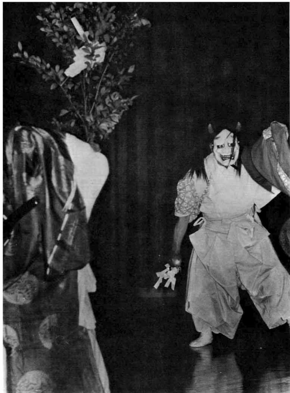
守られる 伝統の舞

発行 昭和52年7月15日 新潟県三島郡三島町役場 ☎ (025842) 代2221 印刷 長岡市(株)中越タイプ社