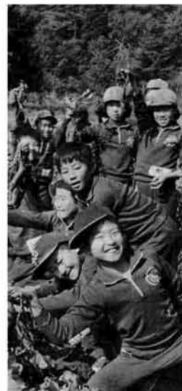
元気な子供たちはいつの時代でも……

所得の制限は…… この手当で定める一級障害(身体障害者手帳の障害の程度とは少し違います)の場合、ひとり月額二万二千五百円、二級障害の場合同じく一万五千円です。毎年四月、八月、十二月の三回に分けて支給されます。 なお、それぞれの所得制限額は今年度、緩和され引き上げられた額です。さらに児童手当を除く二つの手当の支給額は、八月分から増額され適用になる額です。