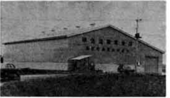
中越地区でも有数の規模を誇る農協倉庫(脇野町農協)