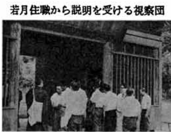
若月住職から説明を受ける視察団

七月二十八日、午前十時すぎ県議会総務文教委員会、建設公安委員会が合同で、逆谷の寛益寺にある県指定文化財などの視察のため来町しました。一行十数名は若月住職らの説明を受けたあと次の視察地出張館に向いました。