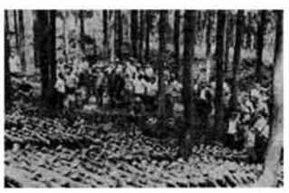
「これが標準的な間伐実施林です」と現地で説明を受ける研修会参加者

「林業経営者育成研修会」が開かれました。今年の研修テーマは「枝打ち、除伐、間伐について」で、午前中町体育館で講義を受けたあと、七日市と後谷の現地二か所、県林業試験場の松田専門技術員から説明を受けました。