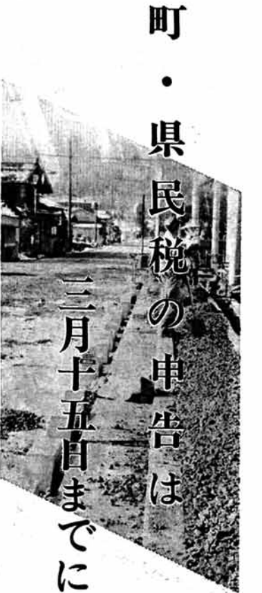
所得税・県民税所得控除額一覧表 (円)