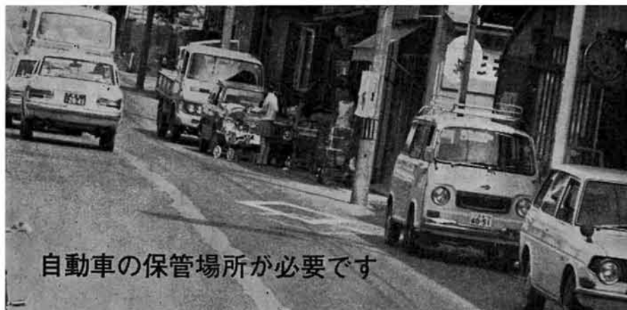
自動車の保管場所が必要です