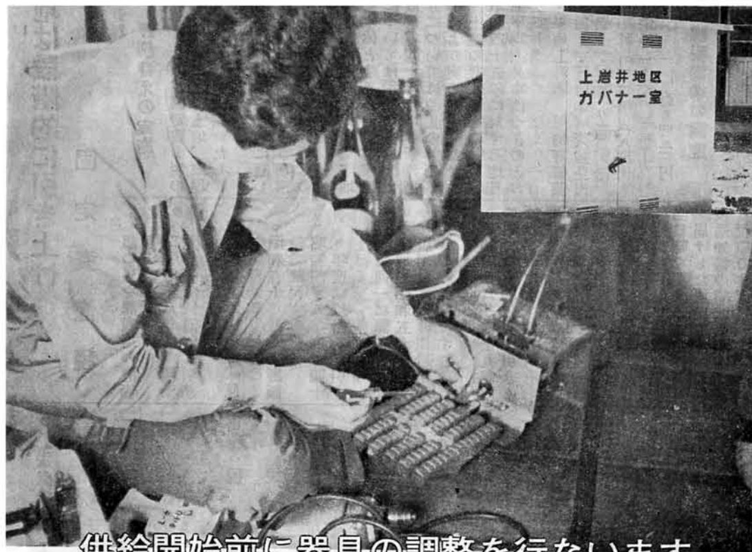
供給開始前に器具の調整を行ないます

新潟県三島町 三島町役場 TEL 脇野町局 局番 025842 代 2 2 2 1 印刷 北越印刷株式会社 長岡市福住1丁目 TEL 0306