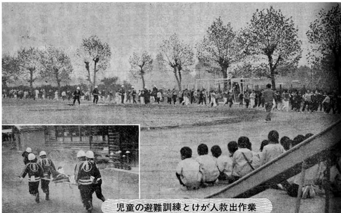
児童の避難訓練とけが人救出作業

発行 昭和46年12月15日 新潟県三島郡 三島町役場 局番 025842 (代) 2221 印刷 北越印刷株式会社 長岡市福住1丁目 TEL (3) 0306