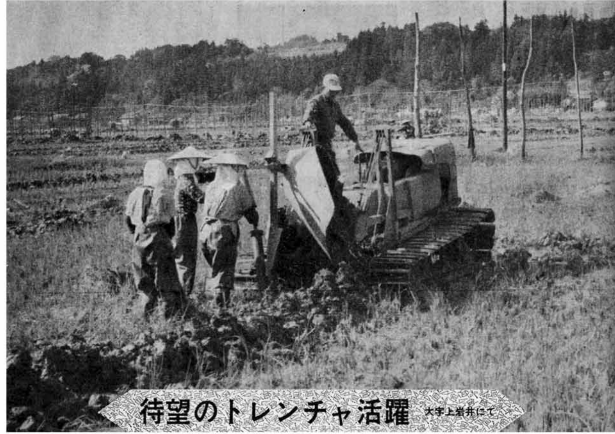
待望のトレンチャ活躍

発行 昭和46年11月15日 新潟県三島郡 三島町役場 局番 025842 (代) 2221 印刷 北越印刷株式会社 長岡市福住1丁目 TEL (3) 0306