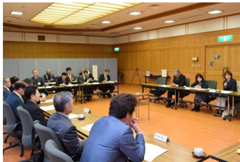
地域委員会の様子

●「地域委員」を公募します 長岡市では、地域住民と一体となったまちづくりを推進し、地域に即した自治活動を行うため、各地域に地域委員会を設置しています。平成29年度の地域委員改選期にあたり、三島地域委員会の委員を募集します。