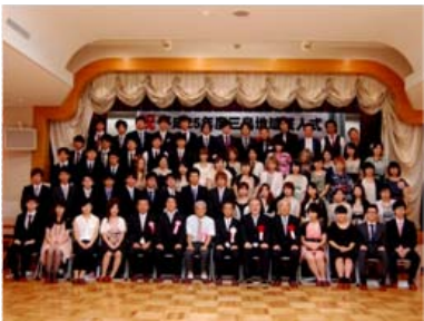
● 8月15日(木) みしま交流センター 二十歳、大人の仲間入り

新成人の皆さんが自ら実行委員会を組織し、企画から当日の運営まで行う成人式。今年には80名で、思い出に残る成人式を迎えることができました。最後は笑顔でバチリ。