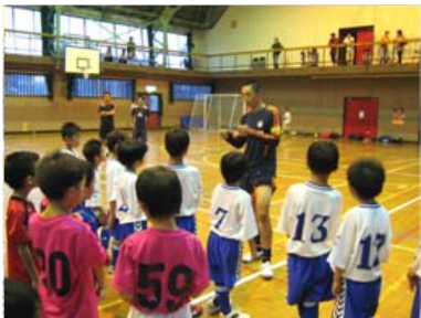
● 9月7日(土) 三島体育センター サッカー少年・少女を応援

小雨が降る中で行われた三島中学校体育祭。騎馬戦や棒倒し、リレーなど、どの種目も白熱の試合展開に。赤軍・青軍どちらも精一杯の力を出し切って頑張りました。