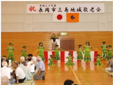
● 9月7日(土) みしま体育館 いつまでも元気でいてね

県主催の「ゆめづくりスポーツ教室」が開催され、アルビレックス新潟で活躍した選手が講師を担当。参加した児童たちは、真剣な表情で講師のレクチャーを受けました。