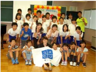
● 8月30日(金) 日吉小学校 夢先生のパワフル授業

新成人の皆さんが自ら実行委員会を組織し、企画から当日の運営まで行う成人式。今年には80名で、思い出に残る成人式を迎えることができました。最後は笑顔でバチリ。