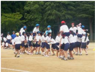
● 9月7日(土) 三島中学校 雨も吹き飛ぶ若いパワー

小雨が降る中で行われた三島中学校体育祭。騎馬戦や棒倒し、リレーなど、どの種目も白熱の試合展開に。赤軍・青軍どちらも精一杯の力を出し切って頑張りました。