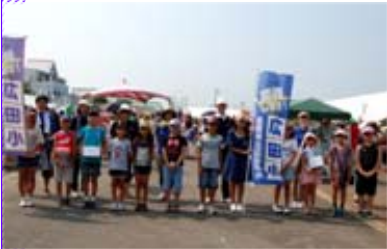
同プロジェクトは、長岡市「熱中!感動!夢づくり教育事業」夢企画を活用しています。

プロジェクトで打ち上げる花火は「白菊(慰霊の花火)」と「金冠柳(復興を願う花火)」の