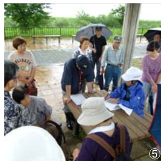
①災害時に心配なことをひとりひとり書き出す。②お年寄り世帯を地図で確認。③地盤の状態を確認。④話し合った防災訓練の計画をまとめる。⑤・⑥防災訓練の実施。隣近所で声をかけあって避難。安否の確認。