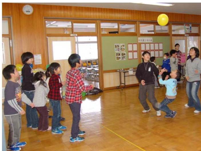
↑ 風船バレー ← ロンドン橋