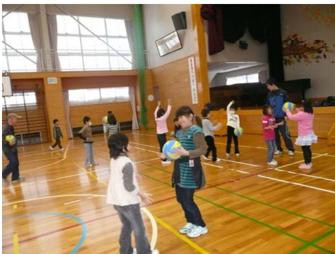
脇野町小学校でのコーディネーショントレーニングの様子 (みしまこどもの広場)