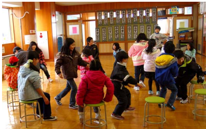
↑ 椅子取りゲーム ← こおり鬼