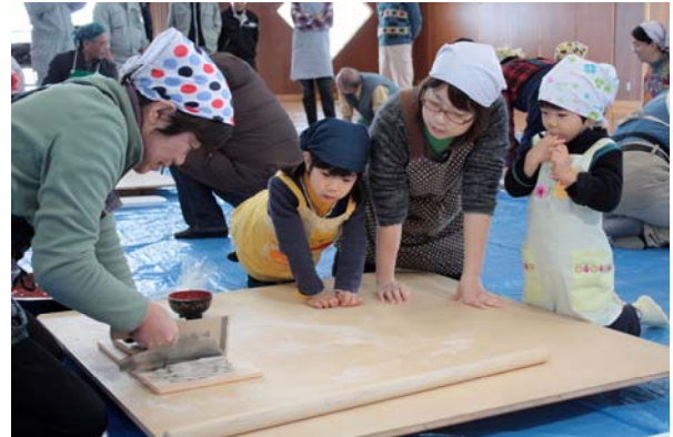
(昨年のそば打ち体験ウィークの様子)

2月14日(火)まで 追加の材料(3~4人分)は1,000円で販売します。(申込時に受付)