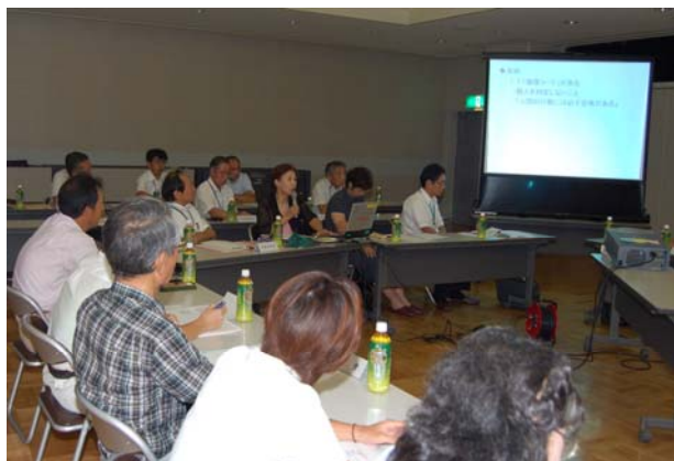
問合せ 地域振興課地域振興・防災係 ☎42-2242

今回の意見交換会を踏まえ、三島地域が安全、安心でさらに住みよいまちになるように、地域委員会と区長会が連携して活動していきます。