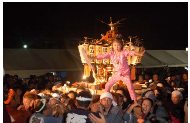
迫力の「みこし渡御」

《今年は新成人の皆さんから竹灯ろうライトアップや丸太早切選手権大会スタッフなどで、まつりを盛り上げていただきました》