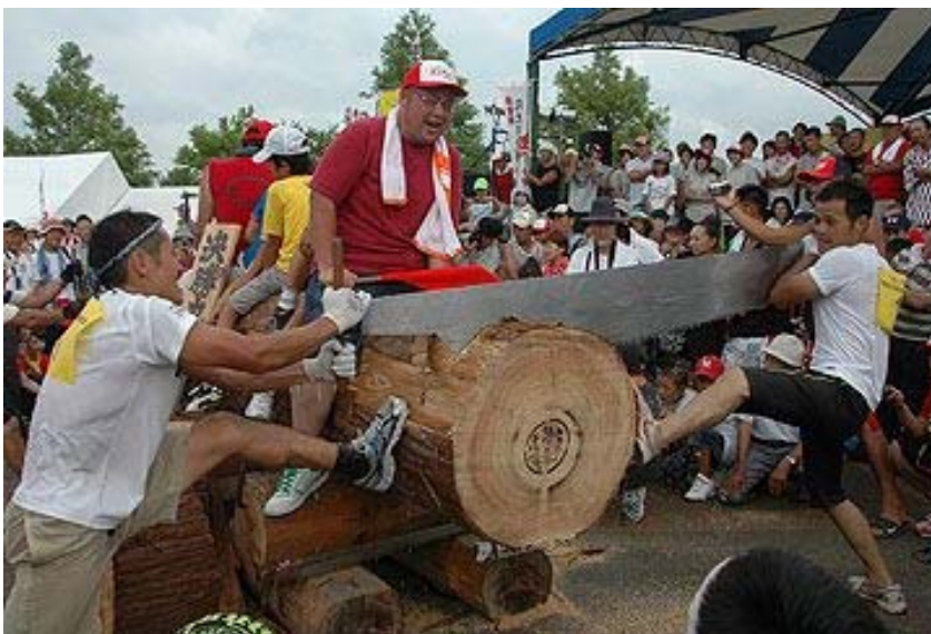
全日本丸太早切選手権大会 一般の部の決勝 ～第20回記念大会を制した新潟市のHART! V2 達成♪～