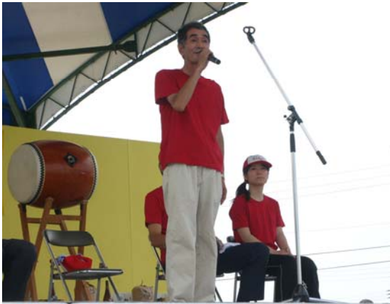
20回の節目を迎えた全日本丸太早切選手権大会