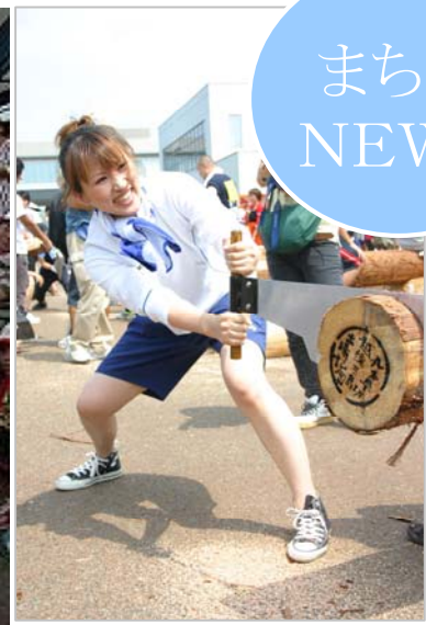
女性の部 予選の様子