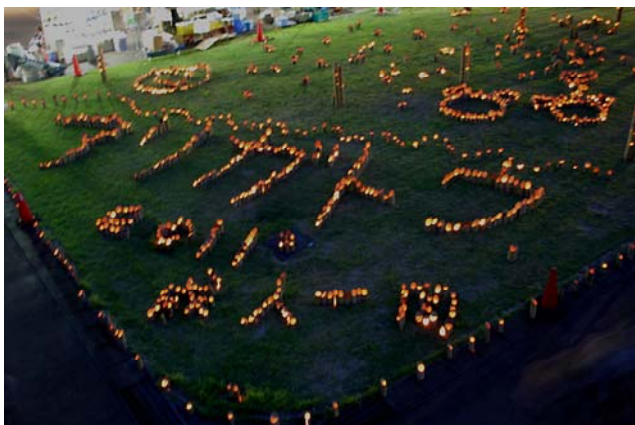
恒例となった「竹灯ろうライトアップ」