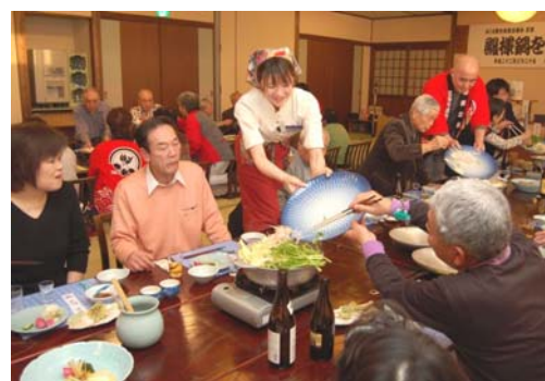
昨年の殿様鍋の様子

日時 3月13日(日)午後3時～7時 会場 旬食・ゆ処・宿 喜芳(調理会場:みしま会館) 服装 エプロン等料理のできる服装 参加料 6,000円(一組2名様分、入浴料込み) 申込み 2月28日(月)まで 問合せ みしま観光推進協議会事務局(三島支所産業課) ☎42-2249 FAX42-3534 E-mail: msm-sangyo@city.nagaoka.lg.jp