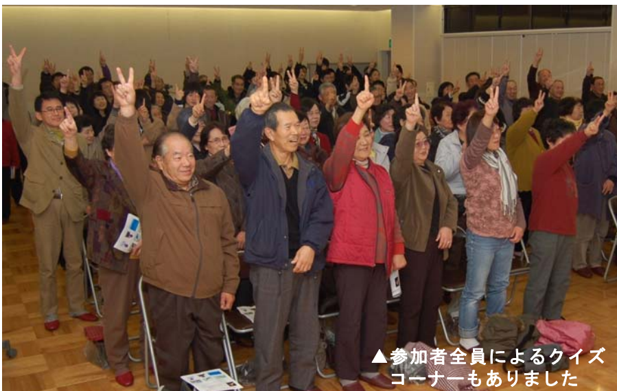
▲参加者全員によるクイズコーナーもありました