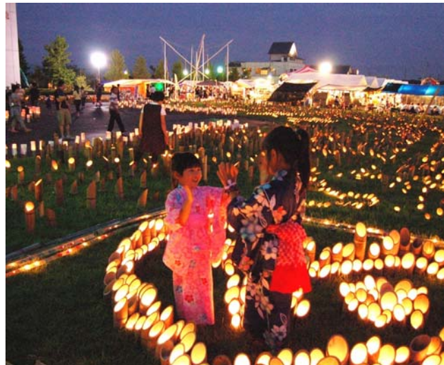
↑三島まつり～竹灯ろう まつり会場にともされた5600灯の光。訪れた人たちは、ほのかに照らし出された光の間を歩いたり、幻想的な世界を写真に収めていました。(8月16日)