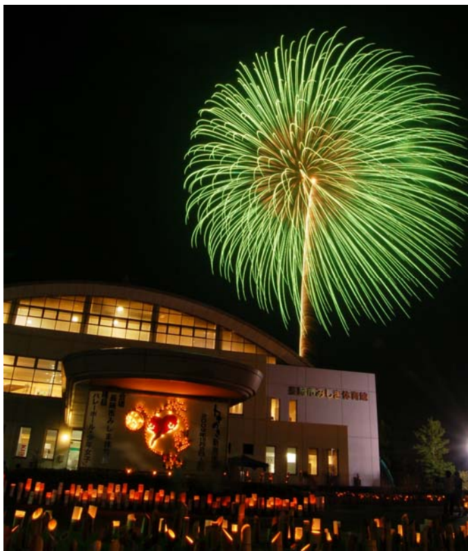
↑三島まつり～竹灯ろうと花火の共演 まばゆい花火の光と、竹灯ろうのやわらかな光が祭りの夜を美しく彩りました。(8月16日)

本紙のカラー版は、市ホームページでご覧になれます。 http://www.city.nagaoka.niigata.jp/shisei/osirase/misima/osirase.html