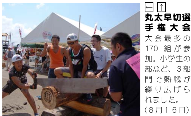
↑丸太早切選手権大会 大会最多の170組が参加。小学生の部など、3部門で熱戦が繰り広げられました。(8月16日)