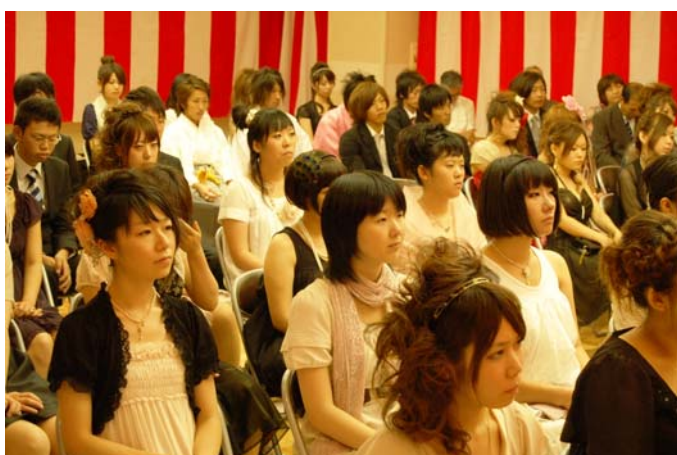
↑三島地域成人式 81人の新成人が記念の節目の日を迎えました。「久しぶり!」「元気?」など、参加した新成人たちは懐かしい仲間たちとの再会を喜び合っていました。(8月15日)