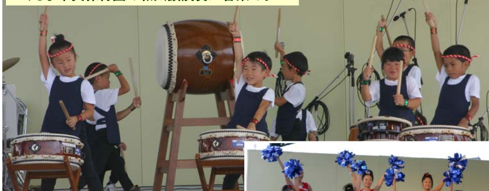
▼みしま中央保育園の和太鼓演奏／音楽のタベ

来場者数 23,000 人! 時折、雨の振る中でのまつりでしたが、会場の熱気に雨雲は吹き飛ばされ、全てのイベントを無事、終了することができました。三島の力を存分に発揮したこのまつりのように、一年中、三島地域で盛り上がりましょう!