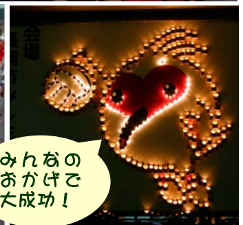
みんなの おかげで 大成功！