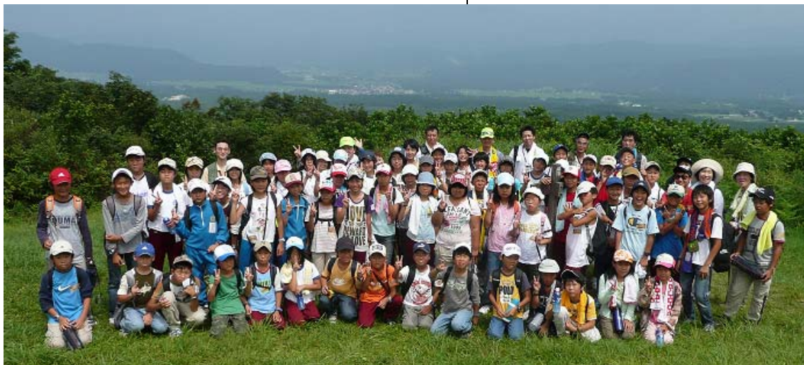
◀坪岳頂上で記念撮影。最高の眺めでした！

実際にやってみて一番心に残って楽しかったのはナイトウォークでした。だいぶ暗くなりそこに驚かされると泣きそうになりますが3回目くらいから慣れてきました。それでも驚いてしまいます。こころへんにいそうだなと思っていてもいなくなったり油断してしまいます。また野外炊事は煙が目にしみてつらかったけど、その分カレーや焼きそばがおいしくなりました。スイッチをつければごはんがたけるのがとても便利なんだなと思いました。今度このような体験学習があったらしたいです。