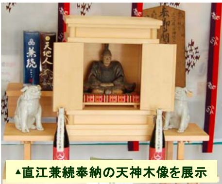
▲直江兼続奉納の天神木像を展示