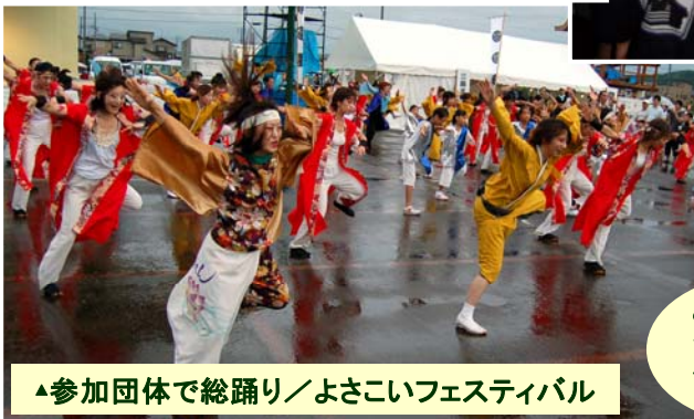
▲参加団体で総踊り／よさこいフェスティバル