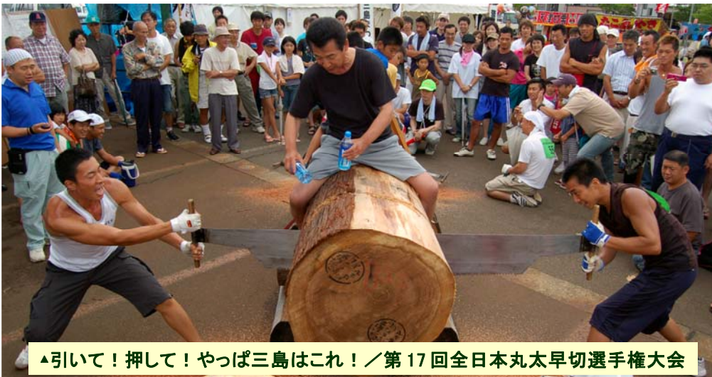
▲引いて！押して！やっぱ三島はこれ！／第17回全日本丸太早切選手権大会