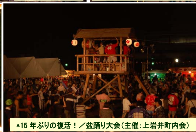
▲15年ぶりの復活!／盆踊り大会(主催:上岩井町内会)