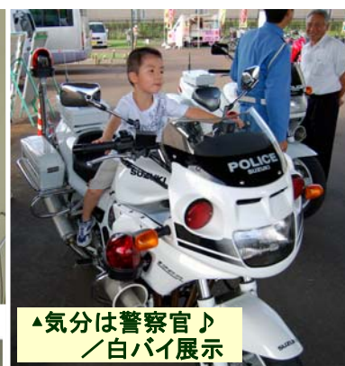
▲気分は警察官♪ ／白バイ展示