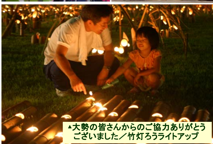
▲大勢の皆さんからのご協力ありがとうございました ／竹灯ろうライトアップ