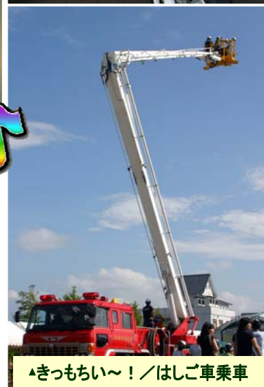
▲きつもちい〜!／はしご車乗車