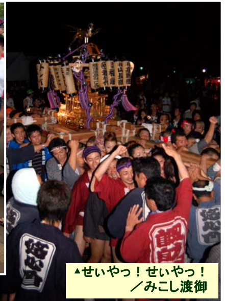
▲せいやっ！せいやっ！ ／みこし渡御