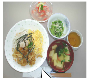
行事食： ちらし寿司