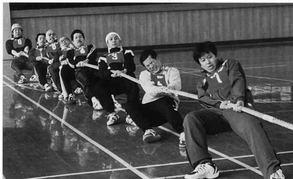
念願の優勝を勝ち取った「協野町小学校B」チーム

3月2日(日)、町体育館を会場に、「町民綱引大会」が開かれました。 この大会には、大字単位のチームをはじめ中学生のチーム、職場の仲間を中心としたチームなど、11チームが参加。 ABブロックに分かれての予選リーグ戦(1本引き)と4チームによる決勝トーナメント戦(3本引き)全31試合で、力と技がぶつかり、迫力のある勝負となりました。 大人を相手に3勝した中学生チームの大健闘、体力が尽きるまで引き合った大熱戦など、例年以上にレベルが高く、盛り上がった大会となりました。