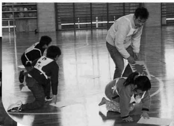
ジャンボカルタとり

協野町小学校体育館にて「レクリエーション大会」を開催。 参加者が4チームに分かれて「フラフープくくり」「ジャンケンピラミッド」「じっぽとりゲーム」をはじめ6種目で競い合いました。 どの競技も年齢や性別に関係なく楽しめる内容だったので、子どもも大人も夢中になって動き回っていました。 閉会式では、河内体育協会長より参加者全員に賞状と賞品が渡されました。