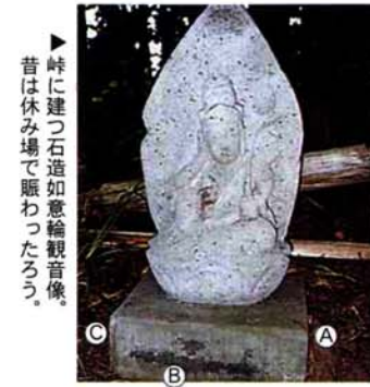
▲峠に建つ石造如意輪観音像。昔は休み場で賑わったろう。

広報みしま 3月号 vol.420 発行/三島町役場 [代表:遠藤鐵四郎] 編集/総務課 (庶務係) 〒940-2392 新潟県三島郡三島町大字上岩井1261-1 TEL 0258-42-2221 FAX 0258-42-2154 http://www.town.mishima.niigata.jp/ E-mail syomu@town.mishima.niigata.jp 印刷/あかつき印刷株式会社