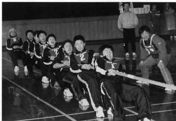
力も技術もアップ! 3勝した中学生チーム