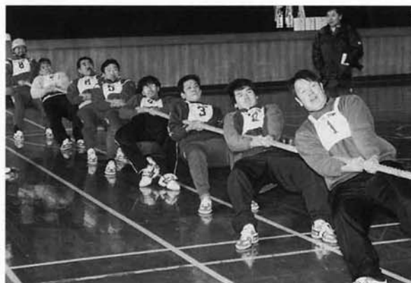
強豪・七日市の伝統を守った「七日市魔人」チーム

3月2日(日)、町体育館を会場に、「町民綱引大会」が開かれました。 この大会には、大字単位のチームをはじめ中学生のチーム、職場の仲間を中心としたチームなど、11チームが参加。 ABブロックに分かれての予選リーグ戦(1本引き)と4チームによる決勝トーナメント戦(3本引き)全31試合で、力と技がぶつかり、迫力のある勝負となりました。 大人を相手に3勝した中学生チームの大健闘、体力が尽きるまで引き合った大熱戦など、例年以上にレベルが高く、盛り上がった大会となりました。