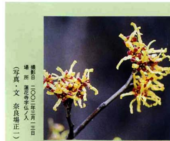
撮影日 二〇〇二年三月三日 場所 蓮花寺仏ノ入 (写真・文 奈良場正一)

法華寺の記録によれば、政右エ門は政吉二十九歳、八兵衛は八平治三十三歳である。如意輪観音は手が六本あって、地藏様と同様、地獄から天上までの六道に苦しむ衆生を救ってくれる。右手を軽く頬にあて、物思いにふけっているが、足は片膝立ちの輪王坐の姿。いざとなればすばやく動き出す姿勢。頭上には化佛の阿彌陀如来を頂いている。なかなかの腕前の石工の手になったもの。西国三十三所とは、近畿地方から岐阜県にかけて散在する三十三か所の観音巡礼霊場である。政右エ門から四人は蓮花寺の人達。西国巡礼を無事果たしたお礼に寄進し建立したものであろう。安政三年(一八五六)―明治まで十三年前―この年の八月にハリスが下田に着任。世情が騒然として来た時代であるが、人々は旅に、巡礼に盛んに動き出していた。さらにこの山道を進むと中永から上ってくる道との出合に、小振りの地藏様。その先には大松(枯れているが)の根本に、すんなりした地藏様が。急な坂道が続くが、直ぐに新しい林道に出る。昭和二十七年十月から脇野町・大津村組合立中学校が授業を開始し、三十年代、中学生は夏場ここを通過して中学校へ通った。雨の日風の日は大変だったという。ところで、政吉・八平治の息子ら五人が、明治三十四年に、又四国巡礼をし、木造の如意輪観音を法華寺に寄進しているのである。(文・写真 中村勝榮)