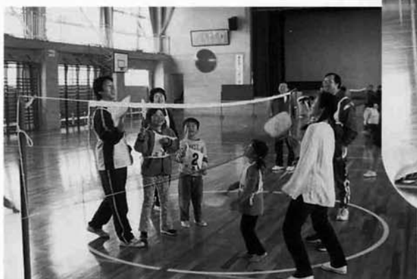
風船バドミントン