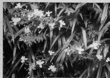
撮影日 一九九〇年五月一日 場所 蓮花寺三ツ池 (写真・文 奈良場正一)

日陰で群落をつくって咲くので、よく目立つ。人家近くに多いことから中国から渡来し、野生化したという説もある。漢字表記は「射干」とするが、中国では「胡蝶花」となっていて、このほうがこの花にふさわしいように感じる。