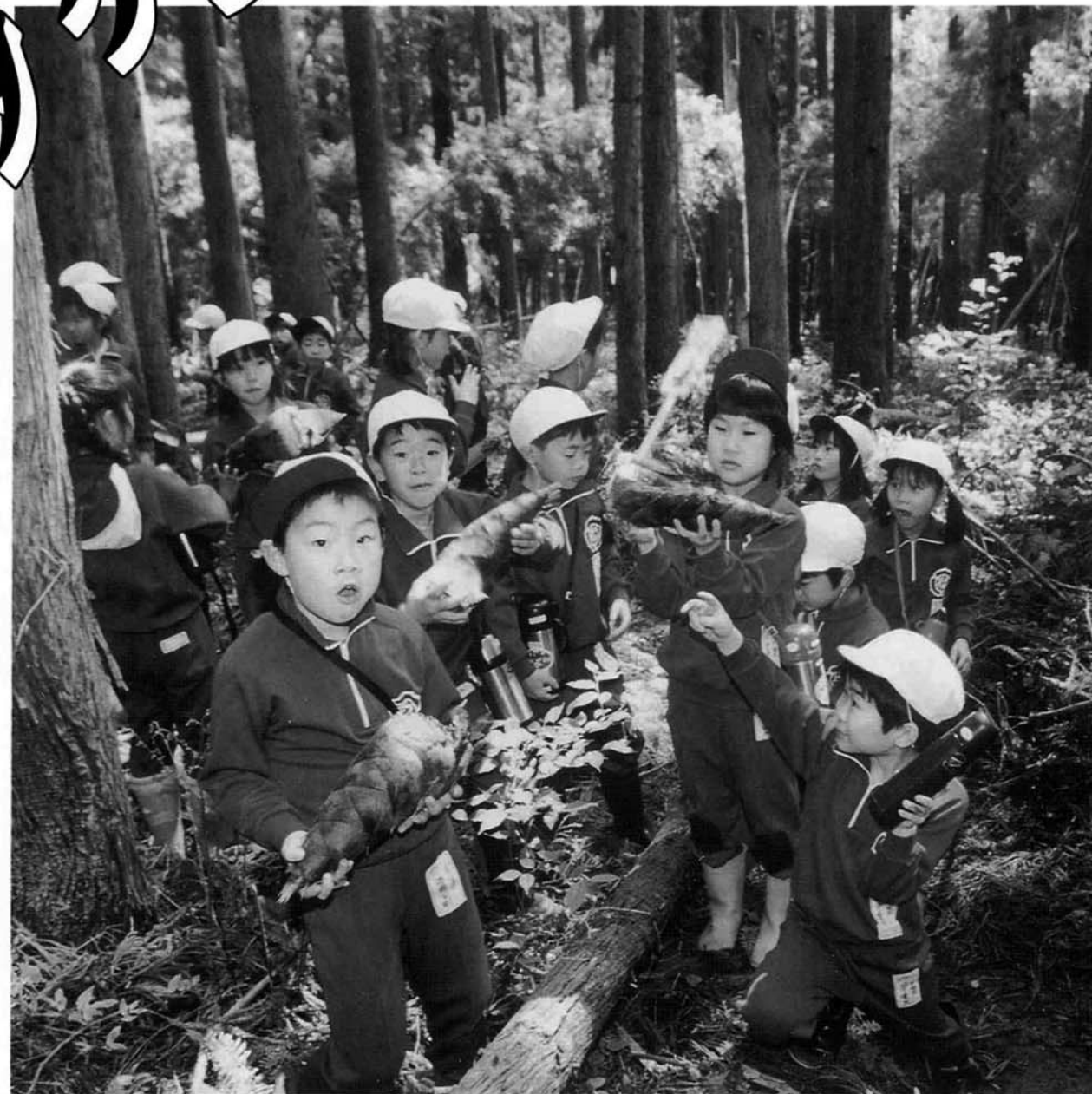
5月9日、脇野町小学校3年生 総合学習にて