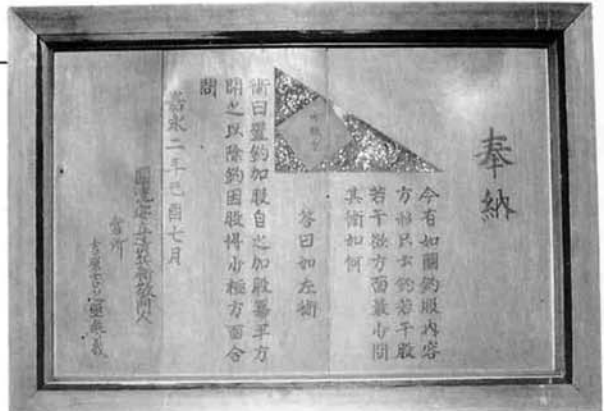
吉原吉之丞奉納の算額 縦72cm×横102cm (現在は三島町郷土資料館に展示)