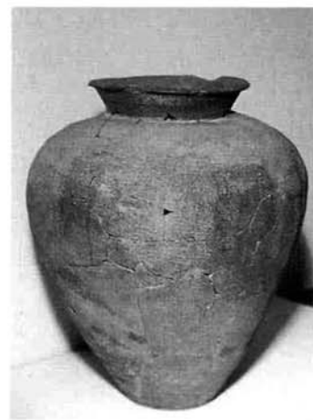
↑復元された「経がめ」