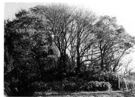
↑西側から見た香塚