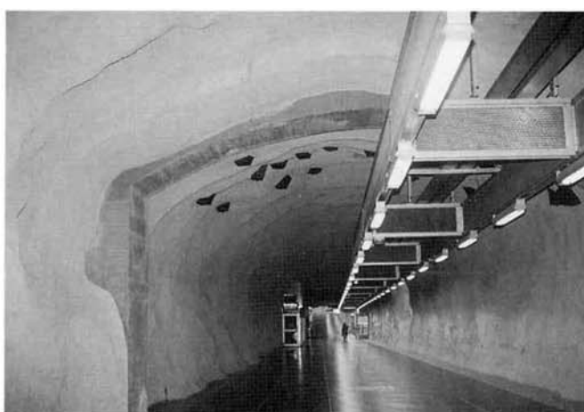
ストックホルムの地下鉄は岩盤をくり抜いて造られている

女性の政治への関心も高く、国会議員の41%が女性で、大臣の半分が女性です。男女がともに社会を支えるという認識の高さが伺えます。日本でも昨年6月23日、男女共同参画社会基本法が施行され、女性の政治への参画が一層期待されるそうです。