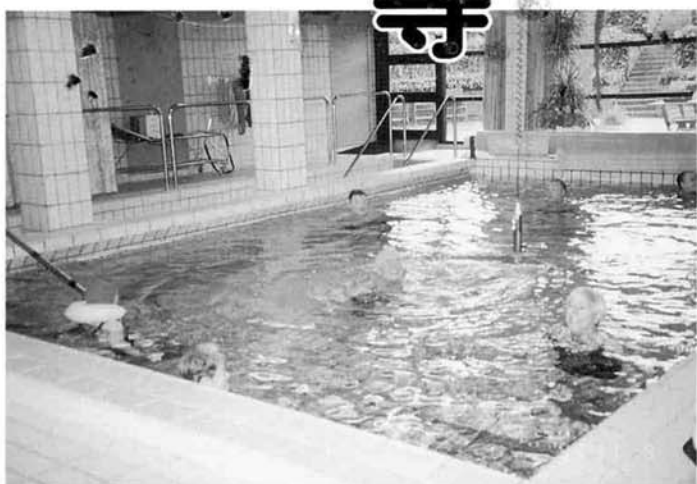
高齢者施設内のプール

福祉と童話のデンマーク。アンデルセン童話が生まれた国。かつての「マツチ売りの少女」のような貧しい時代から、世界最高水準の社会福祉の国へと変化してきたデンマークでは、基本的に貧富の差がありません。人と人が連帯しているこうという精神が憲法にも謳われているように、この基本理念のルーツをたどれば、歴史的な宗教改革にまでさかのぼります。