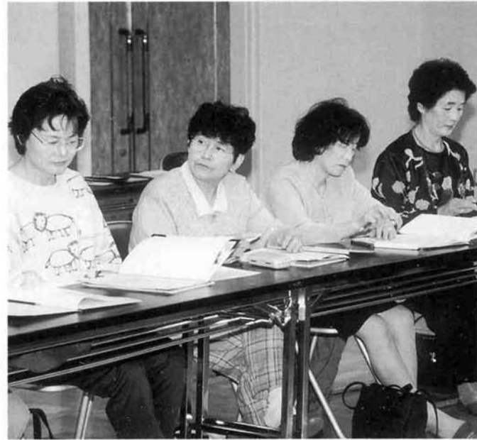
▲女性セミナー開講式