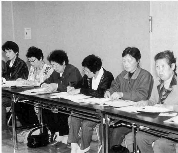
▲ふるさと講座開講式