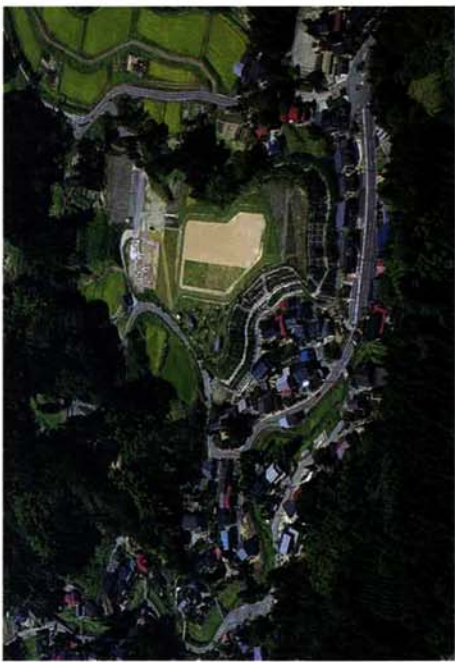
来春開園に向けて工事が進んでいる大杉公園(蓮花寺)

役場では、町内の主な公共施設周辺や家屋密集地区を航空撮影しました。町では、町の様子を記録するとともに行政の参考資料とするため、航空撮影を定期的に実施しています。今年8月23日、約100カットを撮影しました。撮影フィルム(6×7ポジフィルム)を貸し出ししますので、希望される方は企画調整課へ申し出てください。