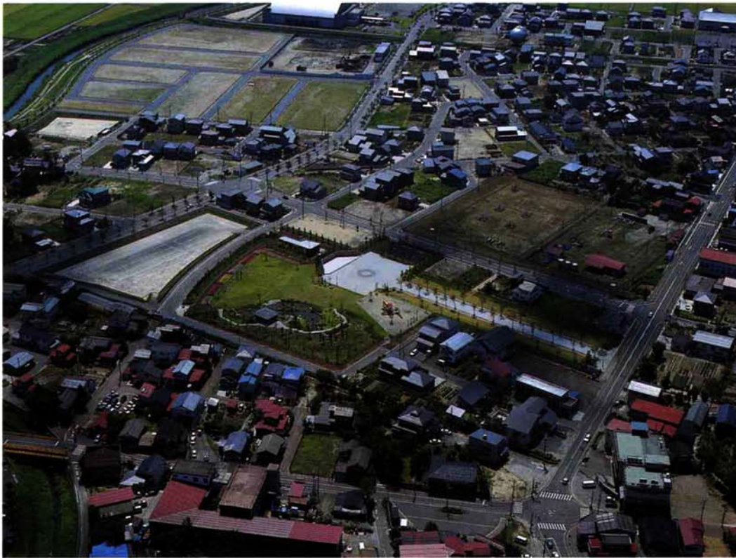
新しい家が建ち並ぶみしま中央団地。手前には中央公園