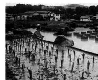
中央公園 (8年3月完成予定) の池に植えられた花菖蒲

▼終戦から50年目を迎え、15日の終戦記念日は、戦後50周年に関連する行事やマスコミ報道でにぎわいました。▼ボスニアを始め、世界各地で今もなお、戦争が勃発しています。第二次大戦後、内戦や国境紛争、出兵など戦争に巻き込まれなかった国は、日本やスカンジナビア諸国、スイス、オーストリアなど数えるほどしかありません。▼戦死者に対する人々のありようも国によっていろいろ。例えばロシアでは、結婚式を挙げた若い2人が最初に行うことは、無名戦士の墓への献花であり、アメリカでも、戦死者名を刻んだ石碑がワシントンにあります。そのほかの献花が絶えないといえます。戦争の是非は問うべくもありませんが、この機会に新ためて、国の大事を信じて闘い、痛々しいほど葛藤し、亡くなった人たちのご冥福をお祈りするとともに、日本の「恒久平和」を願うものです。▼さて、戦時中三島町には戦禍を逃れるため、現在の東京都葛飾区から多くの児童が疎開してきました。これが縁でこのほど葛飾区から、同区萬葉園の花菖蒲が贈られてきました。町では、この花菖蒲を工事中の中央公園の「池」に移植しました。戦時中の集団疎開がとりもった三島町と葛飾区の交流。戦後50年を経て、今後益々発展するよう願われます。