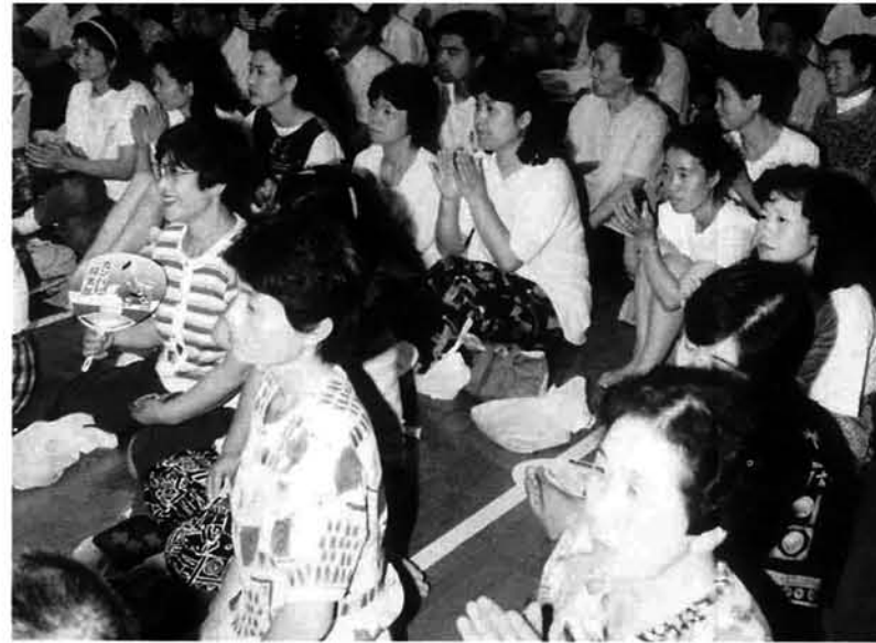
候補者の主張を熱心に聞く有権者(8月4日、合同個人演説会)

任期満了に伴う町議会議員選挙の投票が8月6日、町内7か所の投票所で行われました。町体育館で即日開票され、新しい町民の代表18人が決定し、三島町発展のために活躍していただくことになりました。