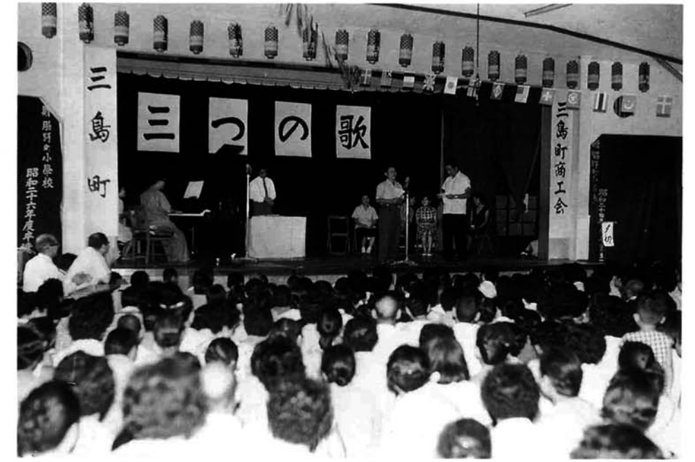
ラジオ番組「三つの歌」公開録音