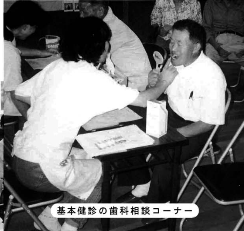
基本健診の歯科相談コーナー