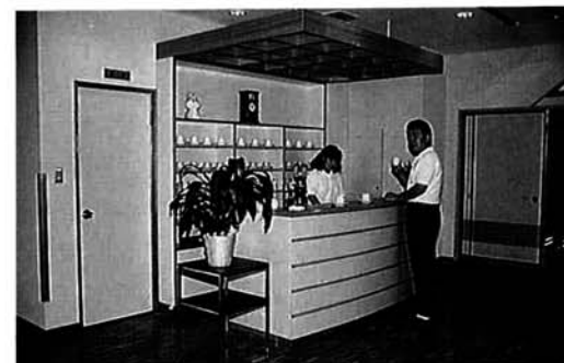
展示ホールに設けられた「コーヒーカウンター」ちょっと一息のくつろぎスペース

みしま中央会館は、農村総合整備モデル事業(国県補助事業)のメイン事業である「農村環境改善センター」と、町が単独で建設した「郷土資料館」が合築した、いわば複合建築物です。一階には、広さ約四六八平方メートルのホールがあります。収容人員は四百人で、町体育館と交流センターのちょうど中間規模に相当します。大きく開かれた窓から自然光がふんだんに入り込み、ステージ、音響設備も整備され、軽いスポーツや式典、各種発表会、展示会など、幅広く利用できます。一階にはほかに、和室の研修室と床張りの営農推進室、農業情報室があり、会議、研修など、多種多様なコミュニティ活動ができる施設です。