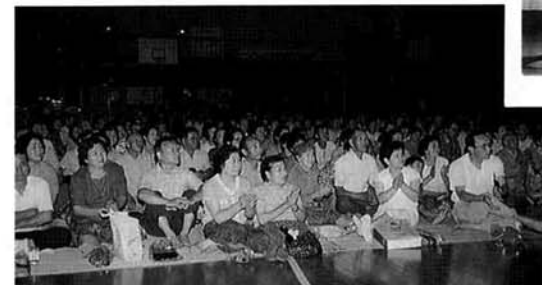
カラオケ大会が大ウケ例年以上に盛りあがった前夜祭。