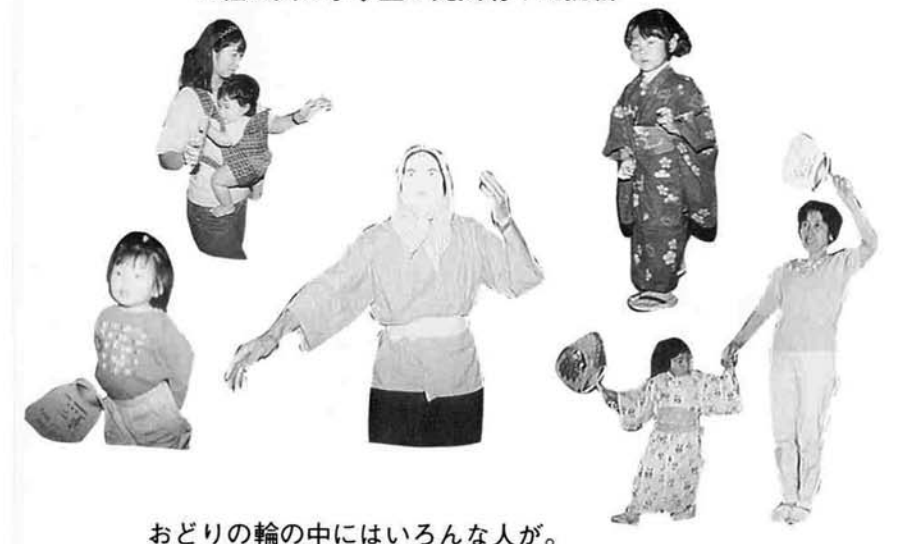
おどりの輪の中にはいろんな人が。