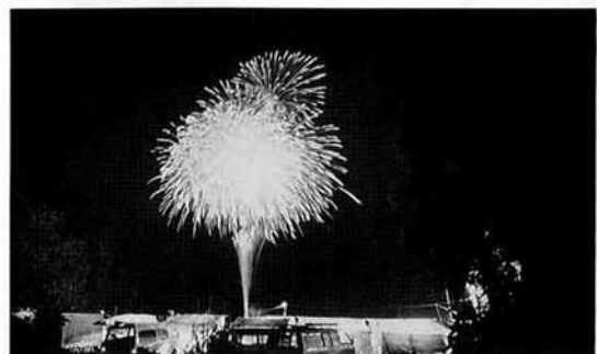
雨ニモマケズ…夜空に大輪の花が咲く