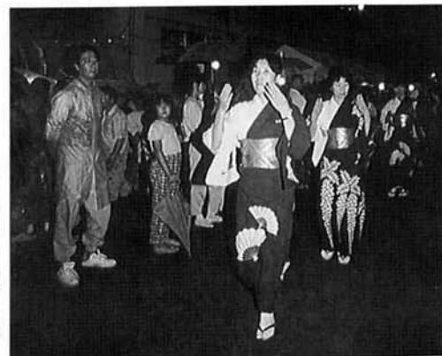
しなやかに踊る踊り子とキャピキャピギャル