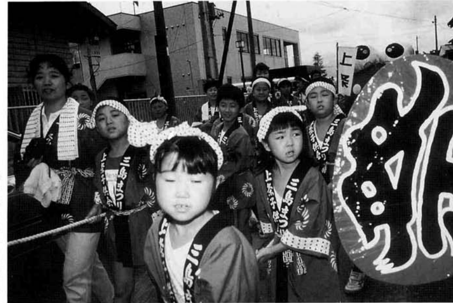
まつりは「子供屋台」で幕開け