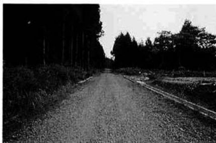
モデル事業で改良される集落道(気比宮緑町～スポーツ広場野球場)

三島町では、昭和63年からモデル事業に着手、これまで農業排水施設、農道などの生産基盤と、農村公園、集落道などの生活基盤を整備してきました。