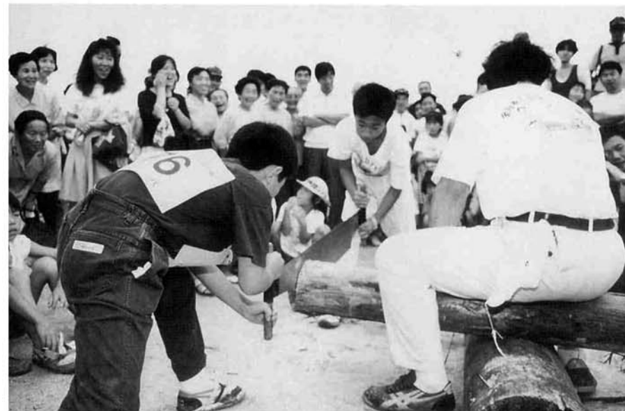
11組22人の小学生が丸太切りに挑戦