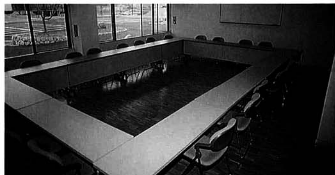
営農推進室(57㎡)は収容人数約20人