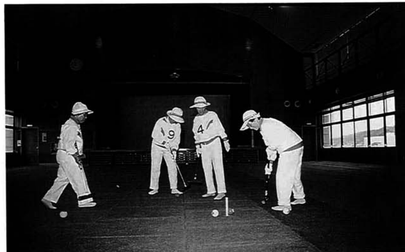
ホール(468㎡)は、マットを敷くと室内ゲートボール場になります

新しい「コミュニティ拠点」 黒い瓦屋根、白垂の和風建築物としてハイセンスなまとまりを見せる「みしま中央会館」。各団体、サークル、仲間同士のコミュニティ活動、研修などにおおいにご利用ください。