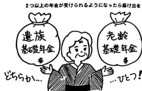
2つ以上の年金が受けられるようになったら届け出を

国民年金の給付は こんなときに うけられます 国民年金には、誰もが共 通して受けられる年金とし て、三つの基礎年金があり ます。 ▽老齢基礎年金 保険料を納めて期間と免 除された期間などを合わせ て、原則として二十五年以 上ある人が、六十五歳から 受けられます。 ▽生涯基礎年金 加入期間中病気やケガに よって障害が残ったとき に、障害の程度により受け られます。 ▽遺族年金 加入している人が亡くな った場合、その人の妻や子 供が受けられます。 これらの年金を受けるに は、毎月の保険料をきちん と納めていることが条件と なります。自分自身の年金 権を確かなものにするため にも、保険料は忘れずに納 めましょう。 また、第一号被保険者自 営者(学生等)については、 次のような独自の給付があ