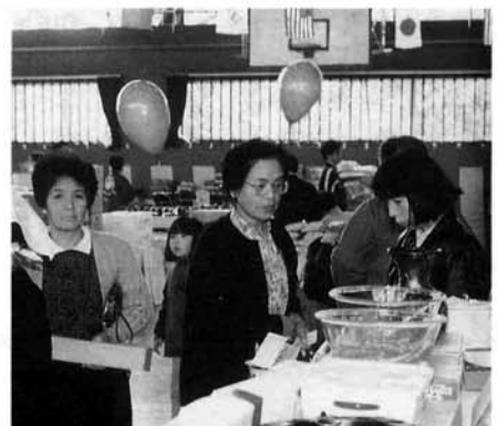
人気を博した「輪なげゲーム」

善意ありがとうございます チャリティーバーゲン 同日開催された日赤奉仕団主催の「チャリティーバーゲン」につきましては、皆様のご協力で十三万五千三百三十円の売り上げとなりました。 町社会福祉協議会を通じて、有効に活用させていただきます。