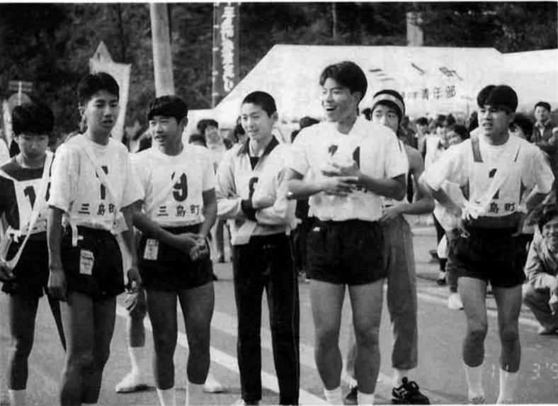
スタート直前の第一走者。余裕と緊張の表情

澄みわたる秋空のもと、大字選抜十三チームが参加し、町民駅伝大会が盛大に開催されました。 昭和四十七年から行われてきたこの大会も今年で二十一回目。今回は第六、七区間(上条、逆谷、上条、三・六キロメートル)に小学生ランナーが初めて登場し、沿道から盛んな声援を受けていました。