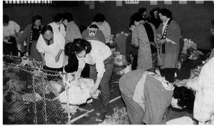
飛ぶような売れ行きだった手づくり野菜市

恒例の秋の祭典、産業まつりが三日、盛大に行われました。 農協、商工会、森林組合など各団体による農林産物、町産品の即売や特売。見せただけでなく、みんなが参加して楽しんでもらうゲーム。「どんな味なの？」と興味をそそられる「芸術おにぎり」。「さつまいもゼリー」などの試食コーナーに大勢の人が詰め掛けました。