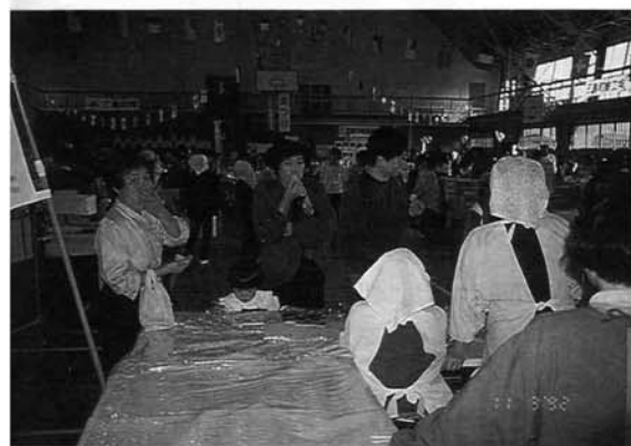
「おもしろおにぎりコンテスト」で珍味の舌鼓