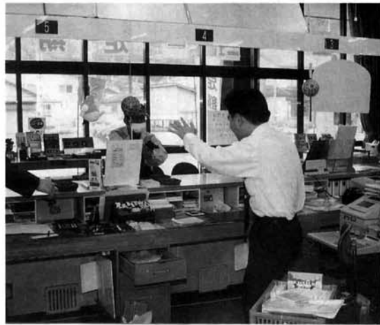
白マスクにピストルを持った強盗が突如乱入

もりあがった 『グリーンピア津南 バスツアー』 ふれあいクラブ主催の「グリーンピア津南バスツアー」が、十一月七日行なわれました。 独身男女の出会いのきっかけづくりが目的のこのイベントに、町内から未婚の男女が多数参加。ほかにも、与板町や長岡市、地元津南町や近隣の十日町市や川西町、東京都から駆け付けた 二十二歳の女性など、総勢三十名の参加者がありました。 自己紹介の後の座談会では、「得意な料理は」「子どもは好きか」といった質問が男性陣、女性陣から飛び交いました。その後、和やかムードでの昼食パーティー。昼過ぎからはゴルフや、ボーリングなどを思い思いに楽しみ、大いに盛り上がったツアーとなりました。 すてきな出会い、見つかったかな！