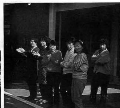
沿道から熱いまなざしで応援する人たち