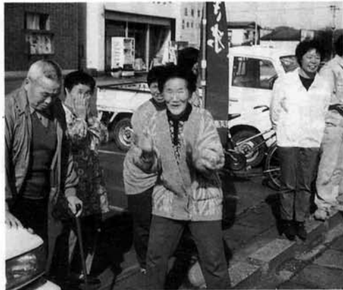
ガンバレガンバレ 熱心に応援するおばあちゃん