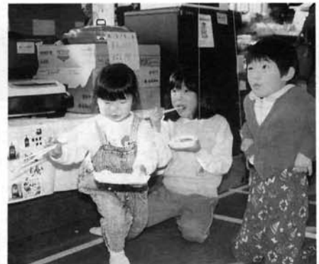
子どもたちもたくさん来場しました