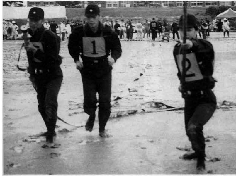
雨ニモマケズ風ニモマケズ…… ドロまみれでがんばる9部の団員