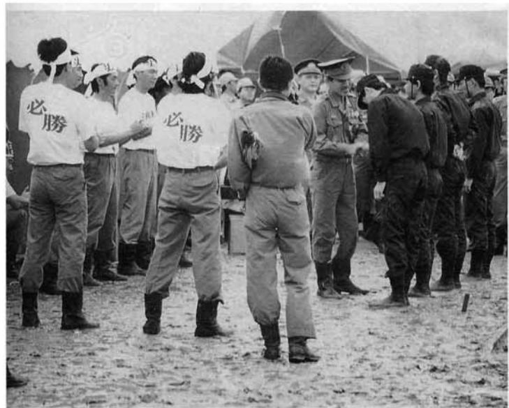
競技を終え、団員にねぎらいの言葉をかける 消防団長ほか、関係者。

八月九日、燕市で行われた「第四十三回新潟県消防大会ポンプ操法競技会」に、第三分団第九部(上岩井)が出場しました。 当日は、台風十号による激しい風雨にみまわれ、コンディションは最悪。団員は水びたしとなったグラウンドで、三月以来、連日練習を積んできた「技」を力強く、見事に披露しました。 連日家庭を犠牲にし、この大会一筋に燃えた九部の団員、また、それを指導した消防団幹部の「愛町精神」が、この成果を納めたものであります。 また、会場には、消防団幹部や選手家族、上岩井区長以下多数の地元応援団も駆け付け、選手の激励に役買いました。 町民の貴重な財産を守り、人命の保護に尽力される消防団に感謝申し上げます。ごくろうさまでした。