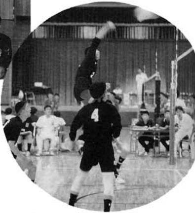
▲息づまる熱戦。三中のチームワークの素晴らしさが光る