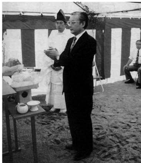
事業の無事成就を願い玉串をささげる町長