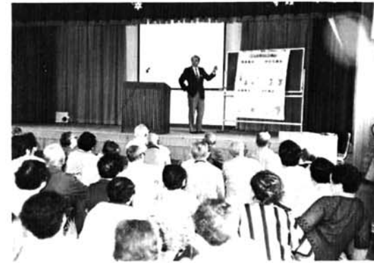
講師の話に熱心に聞く高齢者のみなさん 福祉センターにて

高齢者に適切な学習機会を提供し、健やかな心身と生きがい作りを目的に、越路町高齢者教室が4月21日よりスタートしました。参加費1,000円で、町内在住の65才以上の方なら誰でも参加できますので、家庭生活、社会問題、クラブ活動等に興味のある方は、多数御参加下さい。