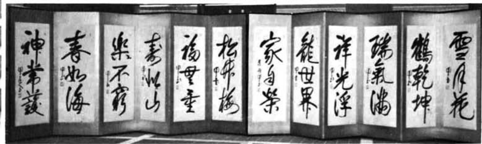
大正7年円了書による屏風 (町資料館蔵)