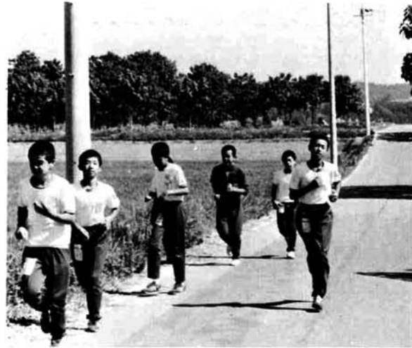
▲ 炎天下の基礎トレーニング(坂を走り下る部活)