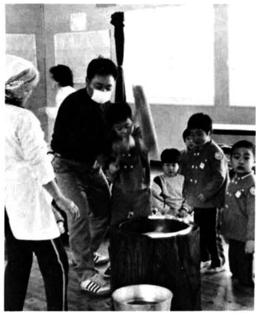
▲ ぼくも早くつきたいな……。 ▼ もちがのびておいしいね

朝から小雪の舞う、十二月十二日塚山保育所(園児75名)でもちつき大会が行われました。