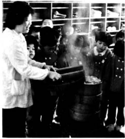
▲ こんなことしてもち米を……

このもちつきは、東谷の木曾さんさんが、もち米やカマド、ウスなど一式を持参しての、もちつき実演によるプレゼントです。つきたての伸びるもちを子どもたちから食べていたところと四年ほど前から塚山保育所で行っています。ペタン・ペタンと大きなキネを高く振り上げ、力いっぱいおもちをつく光景に、子どもたちはヨイショ・ヨイ