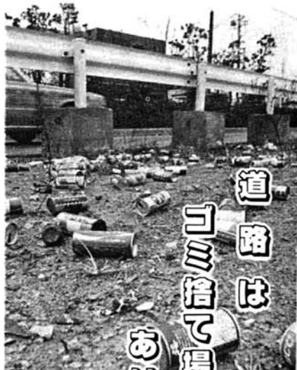
道路は「ゴミ捨て場」ではありません

ててしまう。ゴミを捨てる事のつらさ汚さはあなたが捨てる空き缶も同じです。捨てる前に捨てる習慣を身につけ街をきれいにしましょう。