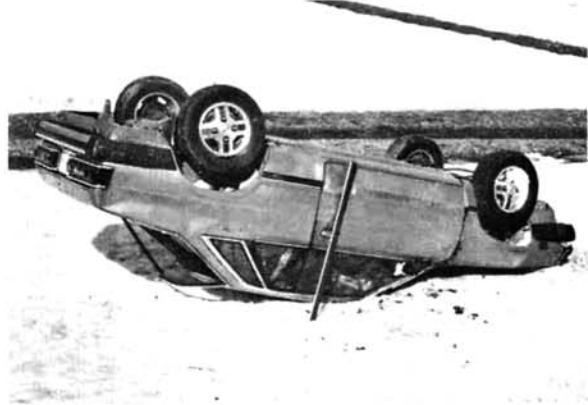
無理な追い越しで転落