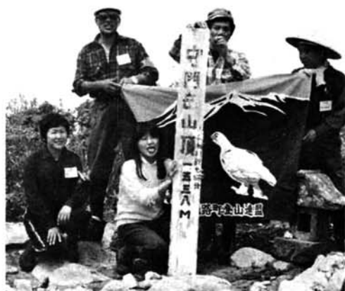
▲ 連盟旗を頂上に掲げる会員

め楽しさを与えてくれる自然を肌で感じてこそその味わいが解るものです。一つの頂きを個人惑は集団で登り、その喜び苦しみを通して、山の自然のとりまく調和の中に私共「登山連盟」の集りがあります。一つの目的を通し個人惑いは職域、同好会のグループの人達が同じ地域に住み、年齢