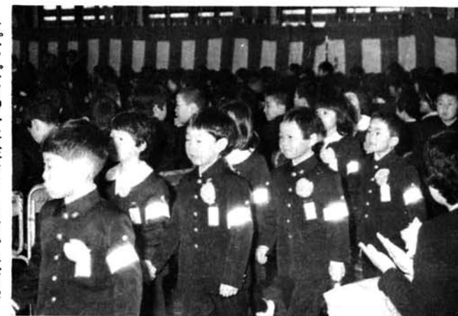
▶ ピカピカの一年生(4・5岩小入学式)