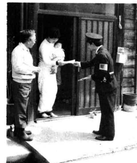
▲ 各戸を廻って防犯の呼びかけ