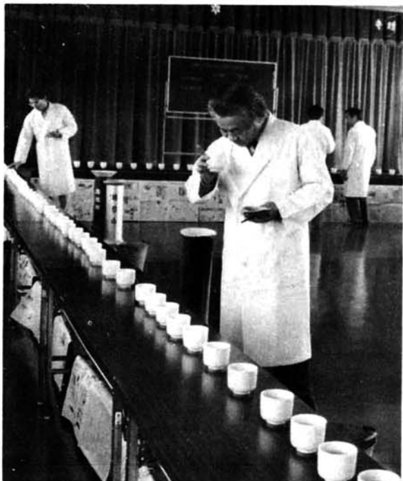
▲ 香り、コク、味...を口に含みながらの審査