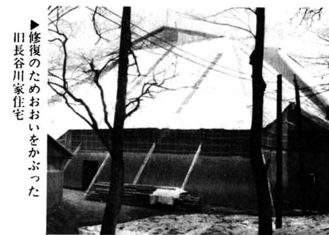
▶ 修復のためおおいをかぶった田長谷川家住宅