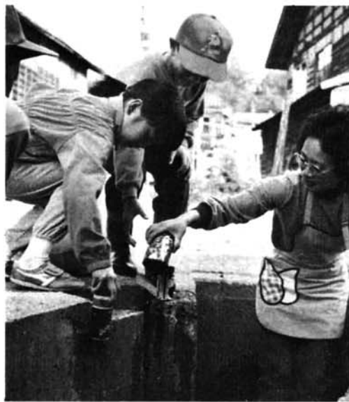
▲ だれが捨てたか…(59年)

「持ち運びに便利だから」「自動販売機などから手軽に買えるから」などの理由で、ジュースやビールなどの缶入り飲料が大モテです。確かに、手軽で、丈夫で、保存のきく缶入り飲料は、消費者にとって大きな魅力。しかしその一方で、投げ捨てられた空き缶が、自然や町並みを汚しています。環境庁が調べた「空き缶の投げ捨て理由」は別記のとおりで、自分勝手なわがままな理由が多くなっています。このような理由で投げ捨てられた空き缶は、地区住民やボランティアの人たちの手によって一つ一つ拾われます。拾われた空き缶は、環境庁の調査で分かっているものだけで、年間四億四千万個、実際はこれよりはるかに多くなるは