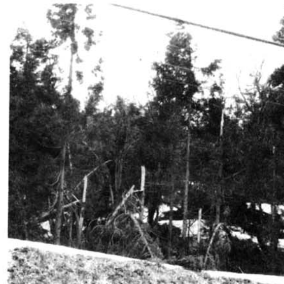
◀ 豪雪で折木が目立つ無残な杉林