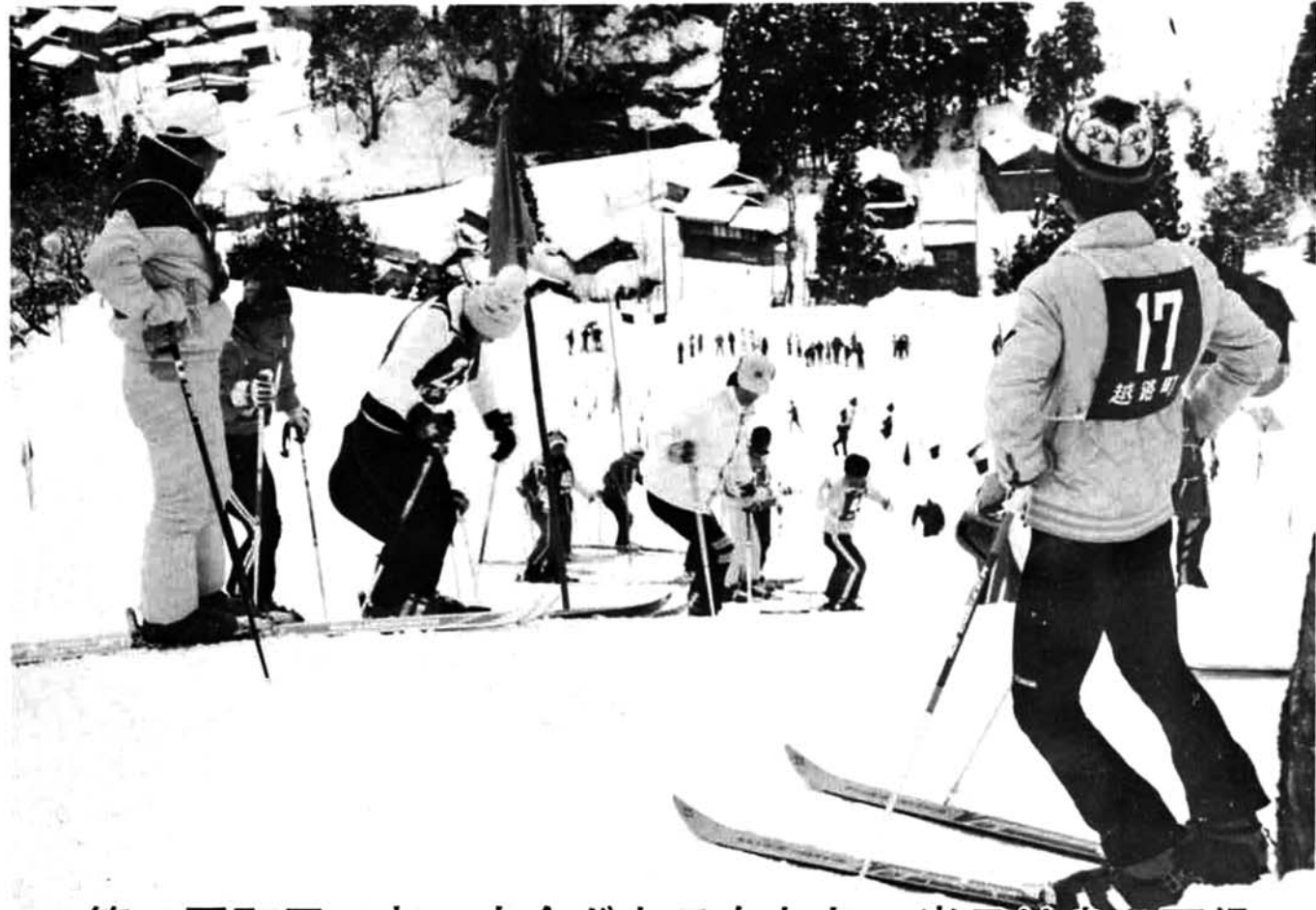
第21回町民スキー大会がおこなわれ、当日は良い天候に恵まれ多数の町民が参加されました。

■ 発行 / 越路町役場 (新潟県三島郡越路町) T.E.L. (02589) 2-3111 ■ 印刷 / 大川印刷株式会社