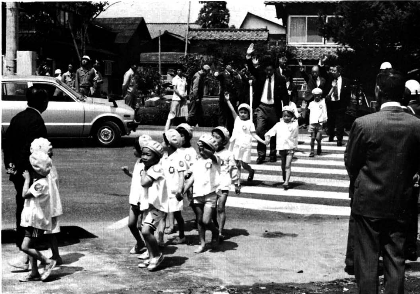
交通量の増大に伴い交通事故防止のため 浦中集会所前交叉点に信号機が設置

■ 発行 / 越路町役場 (新潟県 三島郡越路町) TEL (02589) 2-3111 ■ 印刷 / 大川印刷株式会社