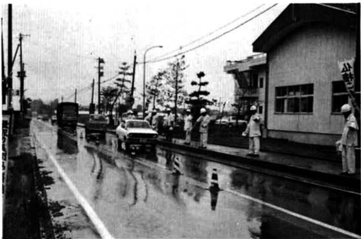
交通安全を訴える、岩塚地区で開催された交通安全指導所