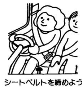
シートベルトを締めよう

自動車事故対策センターは、国が出資して設立された、政府の関係機関です。 全国各都道府県に支所を置いて自動車事故の防止と、被害者保護の増進のための事業を行つています。 その一つとして、センターでは自動車事故による交通遺児に対する育成資金の貸付けを行つています。 自動車事故により保護者が亡くなられた児童 自動車事故により保護者が重度後遺障害者となられた児童がす