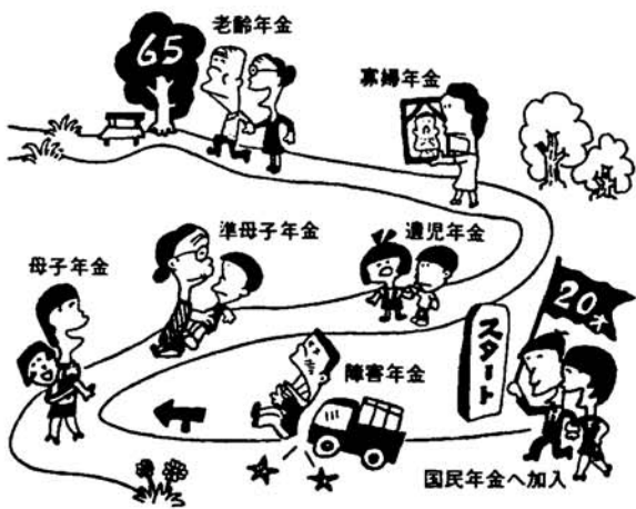
国民年金には、こんな年金があります。

国民年金法が改正されました 国民年金の改正法案が五月十五日の参議院本会議で原案どおり可決され、成立しました。 このたびの改正内容の主なものは一、提出年金では「年金額の物価スライドの実施」福祉年金では、「年金額の引き上げ」「所得制限の緩和」などです。 二、提出年金 提出年金では、総理府が発表する全国消費者物価指数が、前年度に比べて五%を超えて上下した場合、年金額はその率に応じて改定される「物価スライド」制が取り入れられています。 昭和五十五年度における全国消費者物価指数は前年度に比べると七・八%上昇しましたので、老齢年金、障害年金、母子年金など表一のように七月分から引き上げられ、それが支払われるのは九月です。 三、福祉年金 福祉年金も表二のように改正されます。実施は八月分からです、それが支払われるのは十一月です。今年の福祉年金の改定は、今までと違って、老齢福祉年金が、扶養義務者の所得の多少によって、月額一四、〇〇〇円と一三、〇〇〇円の二段階とされたことが特徴です。