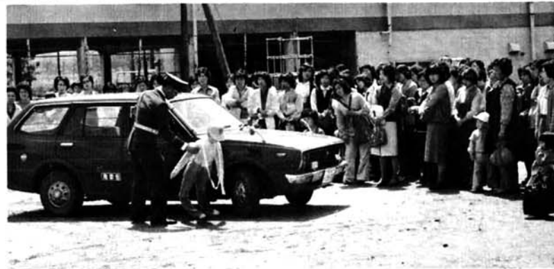
ダミーちゃんできき込みの恐ろしさを説明、実演。