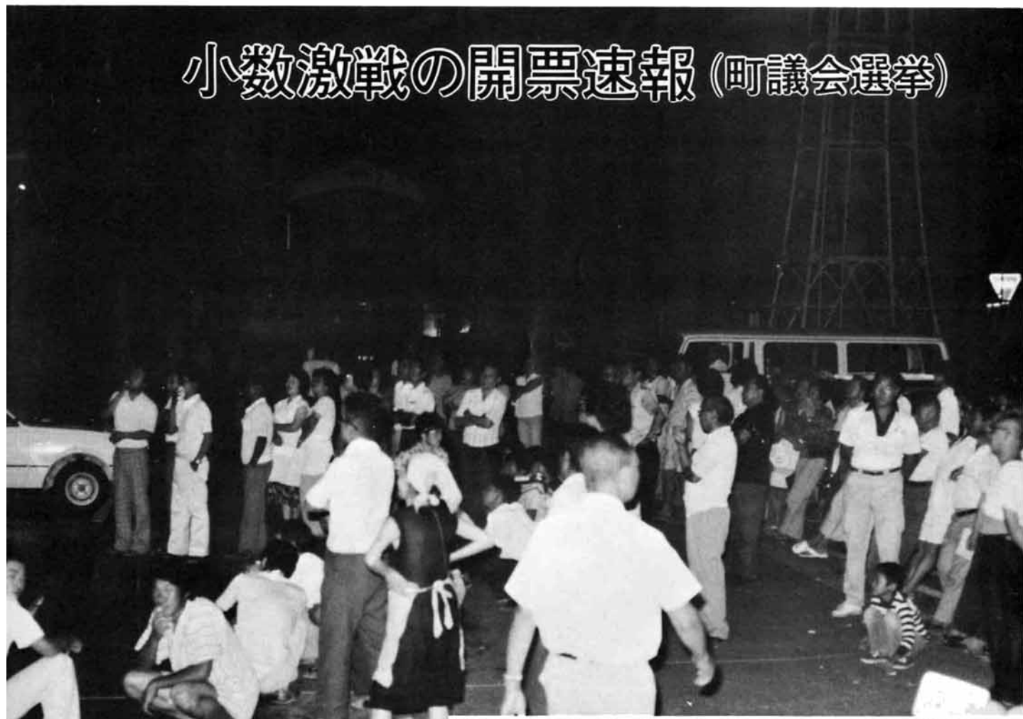
速報板に食い入る町民