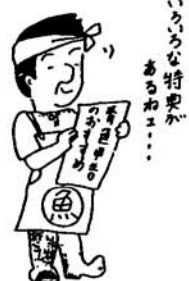
いろいろな特典があるよ……

配偶者や十五歳以上の親族で、その事業にもつばら従事している人に支払った給与は必要経費になります。