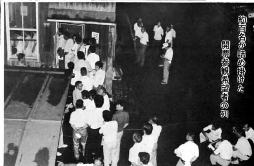
約百名が詰め掛けた