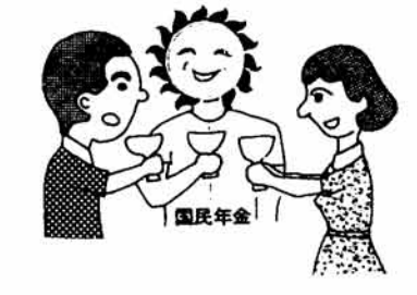
二十歳になったら国民年金

あれから二十年、みなさんと国民年金はともに成人式を迎えました。この国民年金には、一千八百万人という国民が加入し、四百万人以上の人たちがこの制度から年金を受けています。