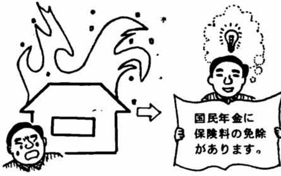
保険料が納められないとき ゆとりがきたら追納しましょう

に、役場国民年金係へ提出してください。 その申請書の内容が免除の基準に該当した場合、保険料は免除されることとなります。 もし、この手続きを怠り、保険料を滞納にしておくと、将来、年金がうけられないこともあります。 しかし、免除をうけた期間は、保険料の滞納ではありませんから年金権は確保されますが、老齢年金や寡婦年金を受け取る際には、この期間の年金額は保険料を納めた場合の三分の一と計算され、どうしても不利になります。