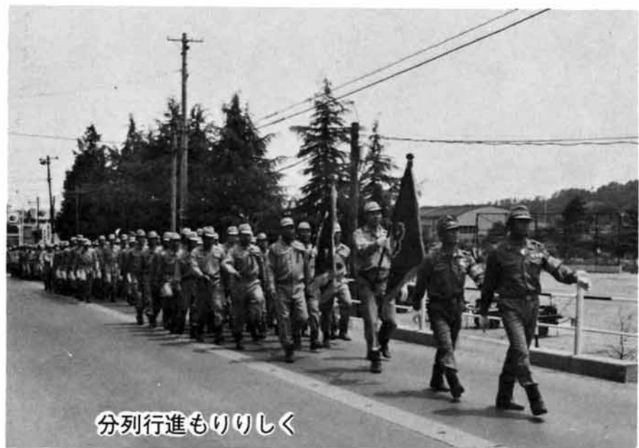
分列行進もりりしく

去る、六月二十五日午前七時、越路町総合消防演習が岩塚小学校グラウンドで行われました。当日は四百五十名の消防団員と自動車ポンプ四台、小型動力ポンプ二十四台の総力が会場に集結し、三十度を超える猛暑の中、同二台のポンプを披露しました。