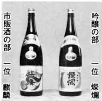
市販酒の部 一位 麒麟