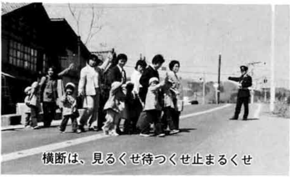
横断は、見るくせ待つくせ止まるくせ

広くするため、新しくサイド・アンダーミラーを取り付け、すでにあるバックミラーとアンダーミラーを大きくする。