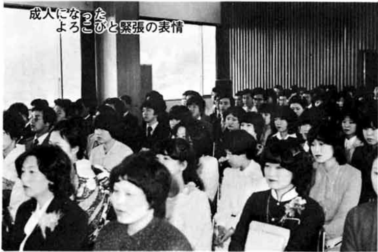
成人になつた喜びと緊張の表情