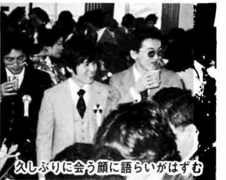
久しぶりに会う顔に語らいがはずむ

しかし、これからは張り合いのある人生にしていきたい。そのために人生的となるものを、旅に