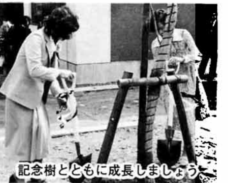
記念樹とともに成長しましょう