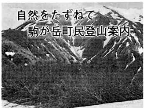
自然をたずねて 駒が岳町民登山案内

● 料理健康教室 開設日 五月十七日(木) (開講式) から十二月まで八回開催(月一回) 会場 町福祉センター 対象者 三十才以上の成人婦人 用意するもの 運動のできる服装、運動靴 申込み 五月九日(水)まで ● 料理健康教室 開設日 五月十七日(木) (開講式) から十二月まで八回開催(月一回) 会場 町福祉センター 対象者 二十才以上の女性 会費 教材費で年間三千元 申込み 五月十日(木)まで