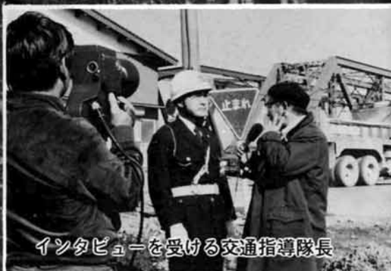
インタビューを受ける交通指導隊長

越路町の交通死亡事故0運動は、昭和五十二年六月十一日から始まり二月末日で六百二十八日間の記録となりました。 この記録を報道するため、県の県民広報課から依頼を受けた新潟放送が交通状況のビデオとりに来町し、交通指導隊長に交通死亡事故0運動が延びている要因などについて、越路橋西詰めでインタビューが行われました。 町では、交通事故防止を主眼とした諸活動を推進しておりますが、町民のみならず、交通ルールを守り事故の絶滅、また死亡事故0運動が永遠に続くようご協力願います。