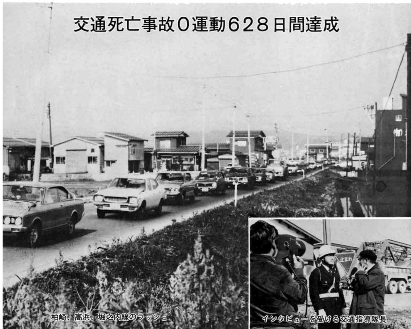
柏崎、高浜、堀之内線のラッシュ