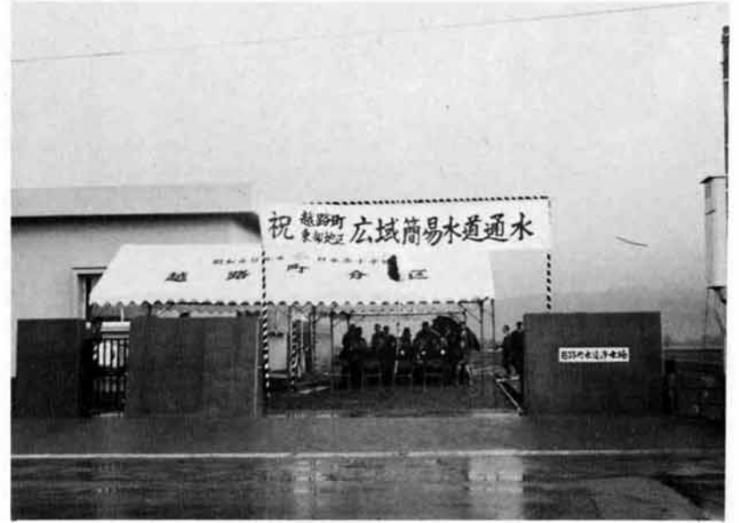
きれいな水が生れる浄水場で通水式

東部広域簡易水道については、皆様方の多大なご協力によりまして十二月十日に無事浄水場において通水式ができたことは誠に感謝に堪えません。 工事施工中にはなにかと皆様方にご迷惑をおかけしたことを深くお詫び申し上げます。