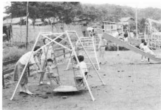
▲塚野山児童遊園地が完成。子供たちの遊び場がほしいと待ち望まれていた塚野山地区にこのほど児童遊園地が完成しました。遊具も取り揃えられ、安全な遊場であり、町民の憩いの場として利用が待たれています。