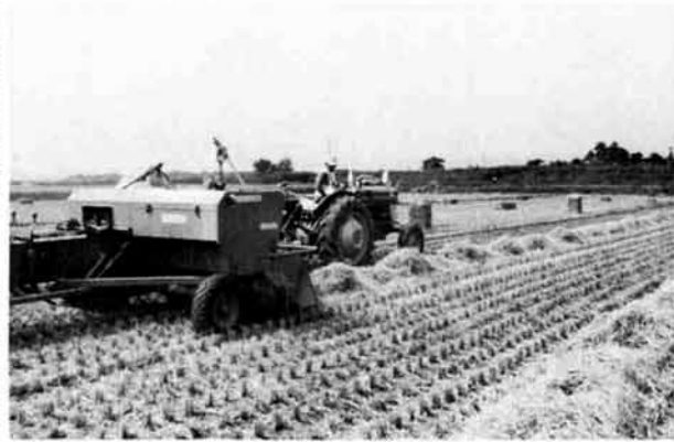
▲ワラ焼き煙公害解消に牧草収集機も一役。コンバインで刈り取った稲ワラを収集結束まで行う、結束したものを積んで堆肥づくりをしたり、家畜の飼料にも利用される。