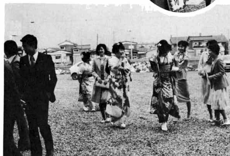
成人としての喜びをかみしめて会場へ