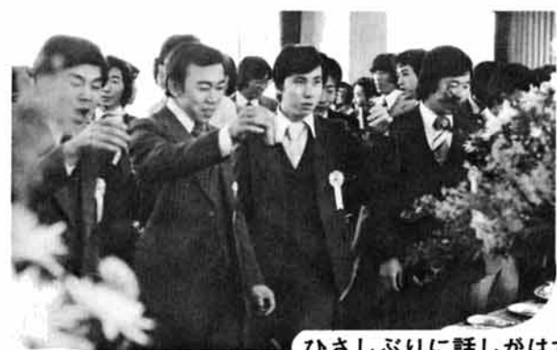
ひさしぶりに話しがはずむ