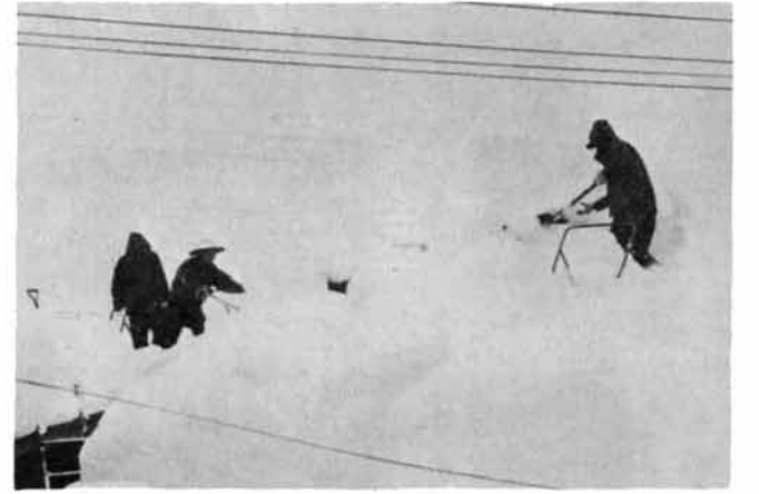
背丈ほどある屋根の雪