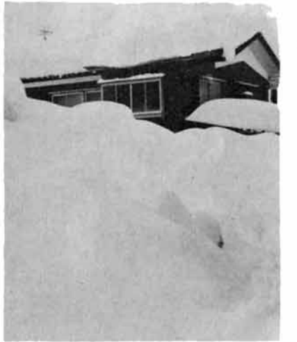
おろした雪が二階の窓まで...