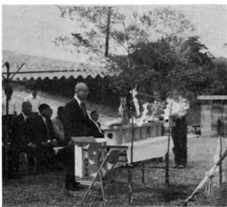
塚山地区ガス起工式

六月二十四日塚山保育所前において、関係者列席のもとに厳粛に起工式がとりおこなわれ、請負業者北栄建設株式会社に、十一月供給開始をめざして、いよいよ工事に着手されました。