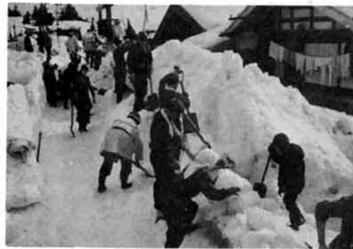
昭和38年豪雪 陸上自衛隊600名救援に来町 2階より高く積った県道の雪