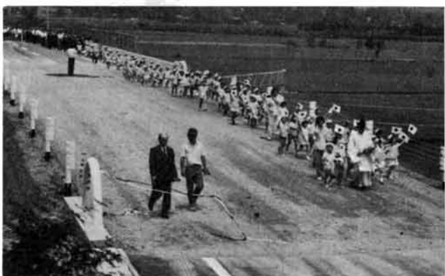
保育園児が参加した渡り初め

平均単価 六十三円二十六銭 (現行 三十八円六十一銭) 改訂期日 十月一日(予定) 公聴会 意見述べたい者は 公聴会に出席して意見を述べようとする者は、住所、氏名(ふりがな)職業及び意見の概要を記して東京通商産業局長あて八月二十三日までに提出する。傍聴を希望する者は、往復はがきで申込むこと。詳細については、ガス供給所へお問合わせください。