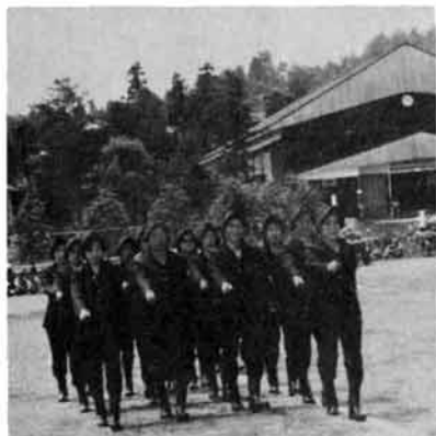
婦人消防隊の小隊訓練

腰には「火の用心」の手ぬぐい背にはヘルメットを背負う団員。ポンプ操法、小隊訓練、模擬消